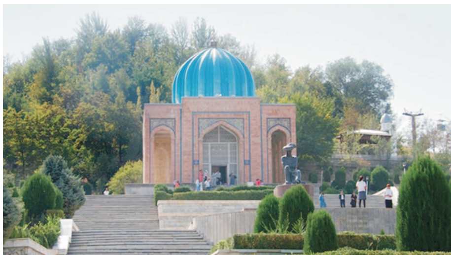
(Давоми, бошланиши 1-саҳифада)

Улуғ юртдошимиз нафақат ўзбек халқи маданияти ва давлатчилиги тарихида, балки жаҳон цивилизациясида ҳам муҳим ўрин тутди. Аллома шоир ижодини пухта ўрганиш, тадқиқ этиш буюк аждодларимиздан қолган улкан ва бебаҳо маънавий мероснинг вориси сифатида ҳар биримиз, айниқса, биз, бугунги давр ёшларининг шарафли вазифамиз, муқаддас бурчимиздир. Бунинг учун юртимизда барча имконият ва шароитлар яратилган.