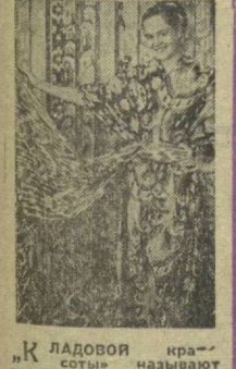
К ЛАДОВОЙ краевой комбинату образцов тканей. Недавно она пополнилась новыми материалами, рисунки для которых разработали художники предприятия. На снимке: работница комбината образцов тканей демонстрирует новые ткани.