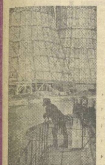
НА НОВОВОНЕЖСКОЙ атомной электростанции пущен реактор 3-го энергоблока мощностью 440 мегаватт. На снимке: один из участков Нововонезской АЭС.