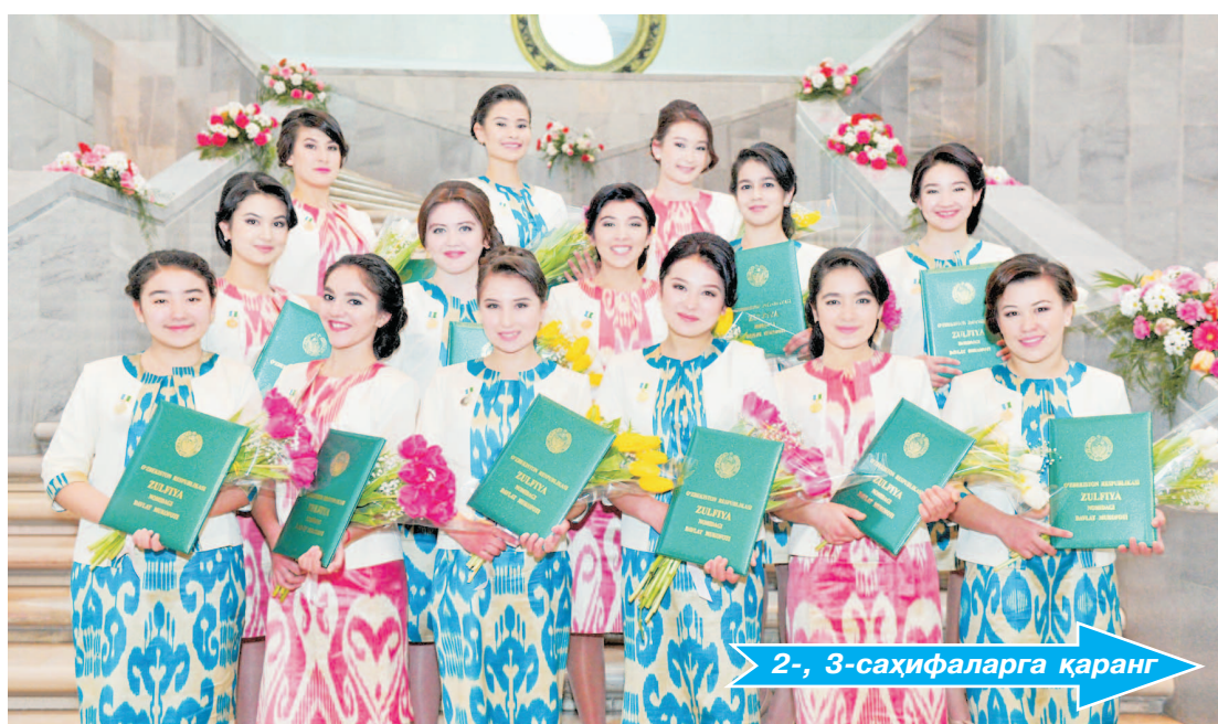
2-, 3-саҳифаларга қаранг