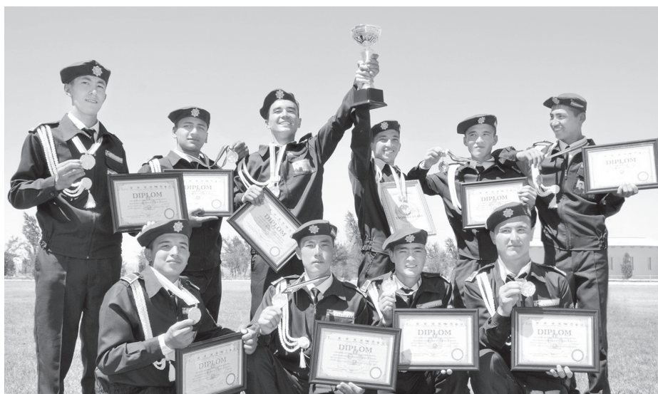
ЎЗА фотомухбири Шерзод НАЗАРОВ олган сурат

Жиззах вилоятида «Шунқорлар» ҳарбий-спорт мусобақасининг республика босқичи бўлиб ўтди. Унда юртимизнинг барча ҳудудларидан сараланган ўн тўртта энг яхши жамоа қатнашди.