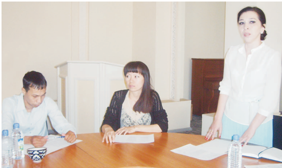
■ Istiqol farzandlari ■