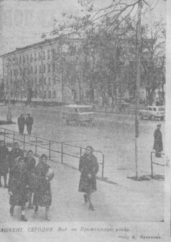
ТАШКЕНТ СЕГОДНЯ. Вид на Пролетарскую улицу.

Типография Объединенного издательства газет «Кизил Узбекистон», «Ташкент Восток» и «Узбекистон сурх», г. Ташкент, П.00816.