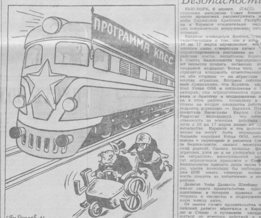
НЕ ТА ТЯГА! Рис. Б. Ефимова, (АПН).