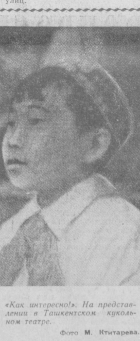
«Как интересно!» На представлении в Ташкентском кукольном театре.