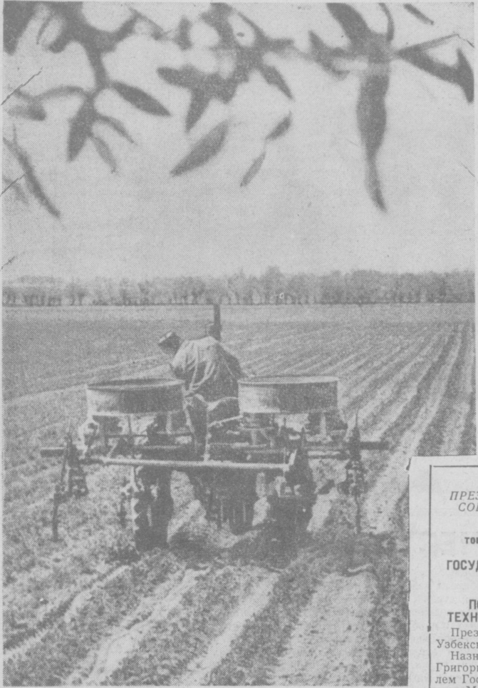
Труженики колхоза «Ленинизм» Янгйулского района решили выращивать наряду с кукурузой и такую ценную кормовую культуру, как горох. В нынешнем году он посеян на шести гектарах, с каждого из которых предусмотрено получить не менее 25—30 центнеров зерна. Собранный урожай будет использоваться как семенной материал под посевы будущего года. На освободившихся землях намечено до конца года заложить плантацию кукурузы. НА СНИМКЕ: культивация посевов гороха.