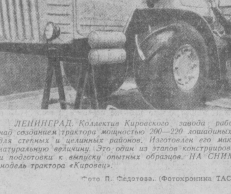
ЛЕНИНГРАД. Коллектив Кировского завода работает над созданием трактора мощностью 200—220 лошадиных сил для степных и целинных районов. Изготовлен его макет в натуральную величину. Это один из этапов конструирования и подготовки к выпуску опытных образцов. НА СНИМКЕ: модель трактора «Киров».