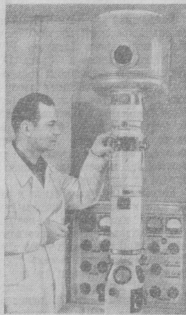
Ежедневно пополняется оборудование лабораторий и кабинетов университета. На снимке: работа с электронным микроскопом в одной из лабораторий.

Узбекистан вместе со всей страной идет навстречу выборам в местные Советы. Агитаторы знакомят избирателей с достижениями республики в хозяйственном и культурном строительстве. Материалы сегодняшней полосы, подготовленной редакцией многотиражной газеты «Среднеазиатский университет», рассказывают о старейшем высшем учебном заведении Средней Азии — Среднеазиатском государственном университете им. В. И. Ленина, о его научной и педагогической деятельности, о крепящихся связях науки с производством, о жизни, учебе, быте многочисленной армии студентов — представителей самых различных национальностей. На примере Среднеазиатского университета видно, какое огромное внимание уделяют партия и правительство воспитанию высококвалифицированных национальных кадров для всех отраслей народного хозяйства и культуры.