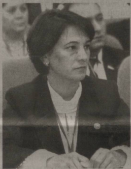
Дилбар МАМАДЖОНОВА, Олий Мажлис Қонунчилик палатаси депутати:

— Тараққиёт стратегияси битта муносабат ёки бир оғиз фикр билан изоҳланадиган, таъриф бериш мумкин бўлган ҳужжат эмас. Чунки унда йўналишлар кўп, вазифалар ҳамда уларга элтувчи чора-тадбирлар бисёр.