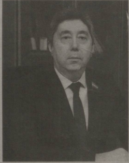
Улуғбек ВАФОВЕВ, Олий Мажлис Қонунчилик палатаси депутати:

— Давлатимиз раҳбари ташаббуси билан қабул қилинган 2017 – 2021 йилларда Ўзбекистон Республикасини ривожлантиришнинг бешта устувор йўналиши бўйича Ҳаракатлар стратегиясини амалга ошириш доирасида аҳолини ижтимоий ҳимоя қилиш ва адолатли ижтимоий сиёсат юритиш борасида жуда катта ишлар амалга оширилди. Биргина 2017 – 2020 йилларда аҳолини ижтимоий қўллаб-қувватлаш йўналишлари оид Президентимизнинг ижтимоий ёрдам масалалари бўйича аниқ чора-тадбирлар белгиланган 40 дан зиёд фармон ва қарори қабул қилинди.