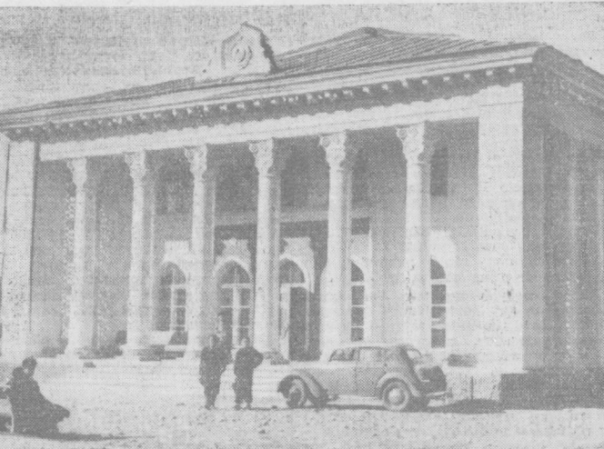
Октябрь район Тахтабула кўчаси томонга йўлнинг тушиб қолса, баҳаво жойда бутун салобатдан ташқари кўча кўтариб турган бу янги бинони кўриб чексиз шодланасиз. Архитектор А. Бобочолов проექти асосида қурилган бу кишлоқ кино-театрга генерал Собир Раҳимов номи берилди.

болганган Унинг молиявий-иқтисодий мажбуриятларидан аначани қисмини бажариб бўлганлигини назарда тутиб. Германиянинг уруш оқибатлари билан болганган молиявий-иқтисодий мажбуриятларини енгиллаштириш тадбирлари Германиянинг тинч экономикасини ривожлантиришда ва аҳолининг моддий фойдаланиши охирида жуда катта ёрдам берибди деб топди. Америка Қўшма Штатлари, Франция, Англия ва СССР ҳукуматлари 1954 йил 1 январьдан бошлаб қуйдагиларни амалга ошириш ҳақида бир фикрга келдилар: 1. Германия ҳар қандай формадаги репарация тўловларидан, шунингдек тўрт давлатга — Америка Қўшма Штатларига, Францияга, Англияга ва СССРга урушдан кейинги давлат қарзларини тўлашдан тамомла овоз қилинади. Савдо мажбуриятлари юзасидан бўлган қарзлар бундан мустаснодир. 2. Тўрт давлат қўшнларининг Германия территориясидан турини билан олоқдор бўлган қарзларини тўлаш қайтарилди, қарзларнинг бир йил ичда Германия Демократик Республикаси ва Германия Федерал республикаси давлат қарзларининг беш процентидан ортиқ бўлмаслиги керак. 3. Германия тўрт давлатнинг таътиб оккупация қаржатлари бўйича 1945 йилдан кейин ҳосил бўлган қарзларини тўлашдан тўла овоз қилинади. СССР делегациясини, Германиянинг уруш оқибатлари билан болганган молиявий-иқтисодий мажбуриятларини енгиллаштириш тадбирлари тўғрисида Германия Америка Қўшма Штатларига, Англияга, Францияга ва Совет Иттифоқига нисбатан уруш оқибатлари билан