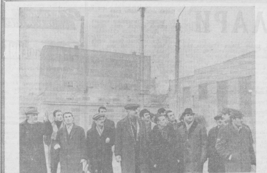
ОЛМАЛИҚ шахридаги В. И. Ленин номида кон-металлургия комбинатининг металлургия саройида СССР ташкил тошганининг 50 йиллигига бағишланган Иттифоқчи республикалар куллари ўтказилмоқда.