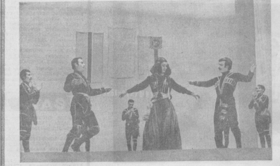
ОЛМАЛИҚ шахридаги В. И. Ленин номида кон-металлургия комбинатининг металлургия саройида СССР ташкил тошганининг 50 йиллигига бағишланган Иттифоқчи республикалар куллари ўтказилмоқда.