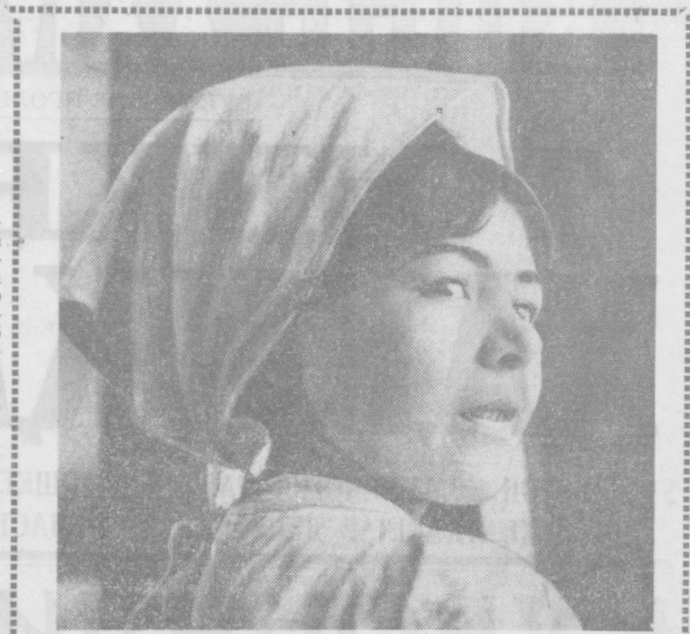
ТОШКЕНТДАГИ «УРТОҚ» НОНДЕР ФАБРИКАСИНING ИЛГОР ИШЧИЛАРИ КПСС XXIV СЪЕДИ ШАРАФИГА ШАХСИЙ МАБУРИЯТЛАР ОЛШАН...