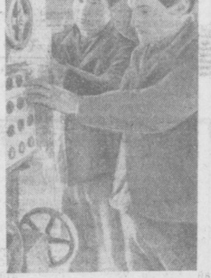
Ўзбекистон Компартияси Марказий Комитети нарийшти чуқур босма...

Чорвадорлар КПССнинг XXIV съездини муносиб соғалар билан кутиб олиш учун курашяптилар.