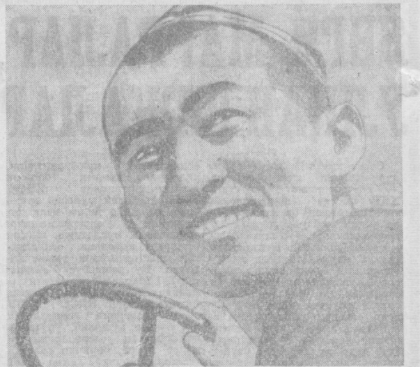
● Социалистик Меҳнат Қаҳрамони, СССР Олий Советининг депутаты Шоймардон Қудратов. Ўтган йили у Сурхондарё областадаги «Советобод» совхозида механик-ҳайдовчи бўлиб ишлаб, машина билан 650 тонна пахта териб олди.

Мамлакат пахтакорлари ажойиб меҳнат ғалабасини қўлга киритдилар. Улар КПСС XXIII съезди қарорларини амалга ошира бориб, ўтган беш йилликда олға қараб катта одим ташладилар. Мамлакатда 30,5 миллион тонна пахта тайёрланди. Бу олдинги беш йилдагига нисбатан 5,5 миллион тонна кўп демакдир. Пахта етиштиришнинг ўртача йиллик ҳажми 4,99 миллион тоннадан 6,1 миллион тоннага етди.