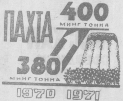
(Тошкент области меҳнаткашларининг 1971 йилги социалистик мажбуриятларидан).