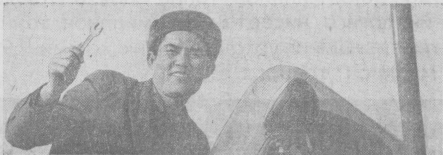
ЯНГИЙЎЛ районидagi «Интернационал» колхозининг механизаторлари КПСС XXIV съезди шарафига бошланган социалистик мусобақада фаол қатнашиб, техника ремонтини жадаллаштирмоқдалар.

ҳамми шанбаликда фаол қатнашишга чақирдилар. Шу кун коллектив учта компрессор ишлаб чиқаради, иш ҳарини эса тўққизинчи беш йиллик фондига беришга аҳд қилинди.