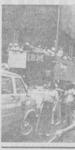
ҲУКУМАТНИНГ РЕАКЦИОН СИЕСАТИГА ҚАРШИ

БАБРУТ, 14 сентябрь. (ТАСС). Қувайтдаги «Ал-Кабас» газетасининг хабар қилишича, Америкада ишлаб чиқариш ва Исроилга тегишли бўлган «Ф-15» ва «Ф-16» қирувчи самолётлари Саудия Арабистони-га бевосита яқин ерга жў-лаштирилиши муносабати билан Саудия Арабистони Қўшма Штатларга норози-лик билдирди.