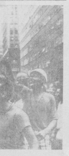
ҲУКУМАТНИНГ РЕАКЦИОН СИЕСАТИГА ҚАРШИ

ЛИССАБОН, 14 сентябрь. (ТАСС). Португалия ком-мунистик Пинт Балсама бошчилигидаги янги ҳуку-матнинг реакцион синьсатига қарши курашни қўлайтири-верди. Бунинг учун комму-нистлар конституцияда қў-лай тутилган барча имкони-ятлардан фойдаланишлар-дан Португалия коммунистик-нинг бош секретари А. Куньял «Жоржиа» ҳафти-маси мухбири билан сўзба-та. У аввалги ҳукуматнинг ағдарилишининг синьсати барбод бўлганидан, ҳукумрон доираларининг мам-лакатда бирнота проблема-ни ҳал этишга қодир эмасли-гини далабат беради. Ҳеч шубҳасиз, деб таъкидлади ПКП бош секретари, янги ҳукуматнинг фаолияти ҳам меҳнатқашлар турмуш ша-роитининг янада ёмонлашу-вида, Португалия бошдан кеңираётган иктисодий, со-циал ва синий қийинчили-ларнинг несишланишига олиб келади. Биз, бу наби-ет ҳам ҳомиятнинг тепасида узоқ тура олмаслигига ағи-ми-из.