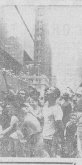
ҲУКУМАТНИНГ РЕАКЦИОН СИЕСАТИГА ҚАРШИ

Америкадаги «Таймс» журнали эса яқинда Исроил-нинг ҳарбий самолётлари рағмлаб маҳсулотлари тў-ғнашув учун Саудия Араби-стони территориясини тепаси-да, нам деганда, икки марта учиб юрганини хабар қи-лади.