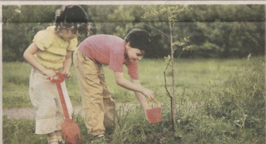
Бегубор болақонларнинг табиатга меҳрли бўлгани жуда ҳам яхши.

Уқувчиларнинг миллий ва маънавий қадриятларимиз, олтин меросимизга бўлган қизиқиши, ҳурмат-эътибори учрашувга келган меҳмонларга ҳам руҳий кўтаринкилик бахш этди. Сайёра ЭШМАТОВА.