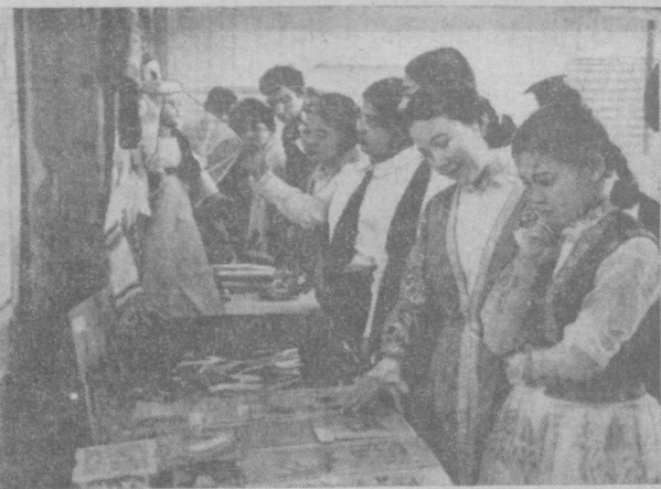
Яқинда Киров районидagi мактаб ўқувчиларнинг «Санъат байрами» кўриги бўлиб ўтди. Бунда райондаги барча мактаб бадий ҳаваскорлари қатнашди. Суратларда 150-мактаб ўқувчиларининг меҳнат кўргазмаси ҳамда 12-мактаб ҳаваскорларининг чқиши.

Бугун Литванинг Шауляй шаҳрида мамлакат биринчилиги учун «А» класин биринчи гуруҳида қатнашган командадорларнинг биринчи тур мусобақалари бошланди. Бунда республикамиз спорт шарафини «Тўнраччи» командаси ҳимоя қилади. Тошкентлик спортчилар Ростов-Донда саралаш мусобақаларида муваффақиятлик қатнашди.