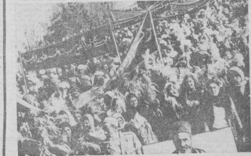
Кобул. «Биз тинчликни хоҳлаймиз!», «Афғонистондан қўлингни торт!» деган широрлар остида АDR хўкуматиинг баёотини қўллаб-қувватловчи намоиш ва митинглар бўлиб ўтди. Хўкуматиинг баёотини Америка империализмининг афғон халқи ички ишларига аралашуви кескин қораланган эди. Шу кунларда Фарах вилоятида оммавий намоиш бўлди. На мўйида ишчилар ва деҳқонлар, танкили дин пешволари, АDR қуролли кўчарининг хизматчилари қатнашдилар. Намойиш иштирокчилари кўтариб ўтган широрларда Рейган маъмуриятининг афғон ақсисини қўллаб-қувватлашга арман қилишга, деб талаб қилинган эди. Афғон халқи, — деб таъкидлашди намоийишчилар, революция душманларининг тарих гилдиригини орқага буршига туринишларга йўл қўймайди. Мамлакат халқи танлаб олган йўл—бахт-севолат ва равақ топши қўйилди, деб хитоб қилишди намоийишчилар.

Афғонистон маъбузи АКШ президентининг ақсиди берган ивағорони баёотини кескин қораламоқда. Жумладан, Бахтар агентлиги революцион Афғонистондаги халқ ҳокимияти мустақамлини қоралашга йўл қўйилди. Афғонистоннинг баёотини таъкидлади. Афғонистоннинг баёотини таъкидлади. Афғонистоннинг баёотини таъкидлади.