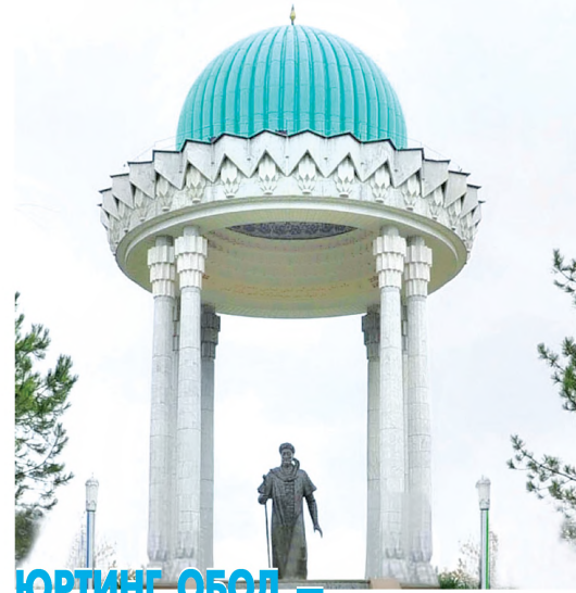
ЮРТИНГ ОБОД — ДИЛИНГ ОБОД ТОШКЕНТ ШАҲРИ

Президентимиз жорий йилнинг 15 март кунин Оқсаройда ўтган Ўзбекистон Болалар спортини ривожлантириш жамоатчаси Хомийлик кенгашининг навбатдаги йиғилишида таъкидлаганидек, ўз фарзандларининг жисмоний, интеллектуал ва маънавий жиҳатдан етук бўлиб, ҳаётда муносиб ўрин эгаллашини энг устувор, энг олий мақсад, деб билган мамлакат ва халқинга юксак тараққиётга эришса олади. Спорт эса, баркамол авлодни тарбиялашда энг муҳим восталардан бири. Уйил-қизлар орасида жисмоний тарбия машғулотларини янада амаллаштириш, истеъодлиларини танлаб олиш борасида Тошкент шаҳрида амалга оширилаётган ишлар ҳам эътиборга молик. Биргина ўтган йили 12 та иншоот фойдаланишга топширилган бўлса, шундан 2 таси болалар спорт объектлари, 4 таси сўзиш ҳавзаси, 6 таси эса болалар мусиқа ва санъат мактабларидир. Шунингдек, 2012 йилда 70 га яқин болалар майдончалари қурилди ва пойтахтдаги майдончаларнинг умумий сонини бир минг тўққиз юзга яқинлаштирди. Манзилли дастурга асосан, жорий йилда ушбу мақсадларга 5700 млн. сўм хомийлик ёрдами йўналтирилди. Йил давомида 10 та объект қуриш ва реконструкция қилиш режалаштирилган. Ушбу иншоотларни спорт жиҳазлари билан таъминлаш ҳам эътиборда. Бугунги кунга қадар Тошкент шаҳридаги спорт ва таълим муассасаларига 102,5 млн. сўмлик спорт жиҳазлари ажратилган.