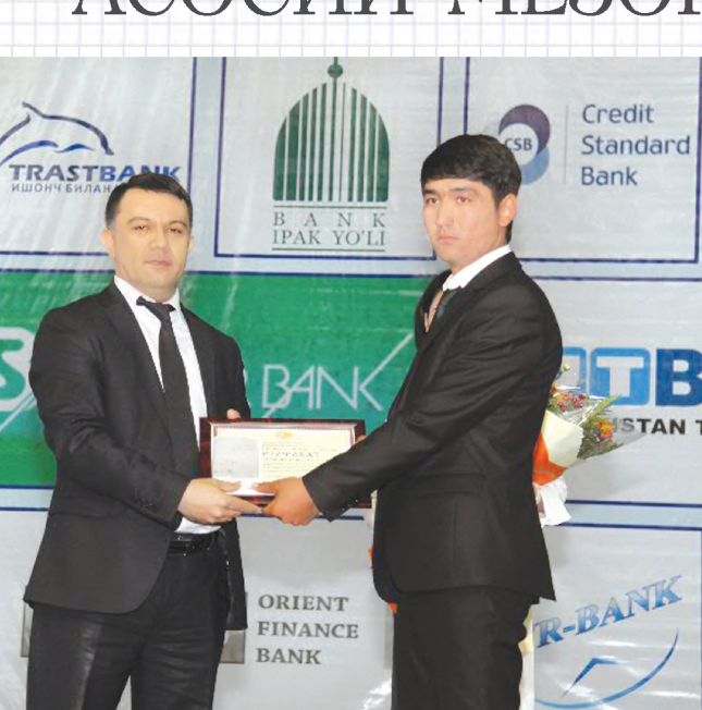
Амалга оширилаётган ишлар муносиб баҳоланмоқда. Жумладан, жорий йилнинг 10-11 апрель кунлари «Ўзқурғаз-масавдо» марказида ўтказилган банк технологиялари, ускуналари ва хизматлари бағишланган анъанавий «BankExpo — 2013» миллий курғазмада мазкур банк «Инновацион лойиҳаларни қўлаб-қувватловчи энг янги банк» номинацияси бўйича голиб, деб топилди. Бу юксак эътироф «Асака» давлат-акциядорлик тижорат банки жамоасини янги марралар сари илҳомлаштириши тайин.

Мазкур банк ўз фаолиятини жаҳон стандартлари талаблари даражасига етказишга интилиш орқали мамлакатда юқори рақобатбардош, ички бозор ва экспорт талабларига мос маҳсулотлар ишлаб чиқаришга кўмаклашмоқда. Устувор мақсадлар сари интилаётган «Асака» давлат-акциядорлик тижорат банки кундан-кунга сони ортаётган мижозларига юқори сифатли банк хизматларини тақдим этиб, ҳар томонлама ишончли ҳамкорга айланаётди.