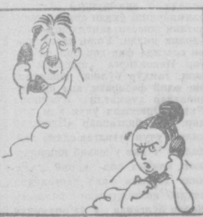
ХОТИН: Алло, алло, қачон келасиз? ЭР: Ме... е... те... эда ет... иб борра...май...