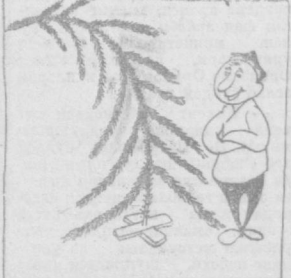
Лаганбардор: — Ҳўп, менбон арча экансан.