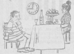
— Дод десангиз ҳам ўн иккига ча чидасиз.