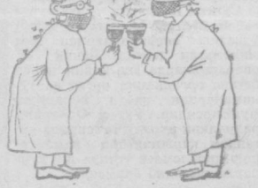
— Операциядан чиққан беморликнинг саломатлиги учун.