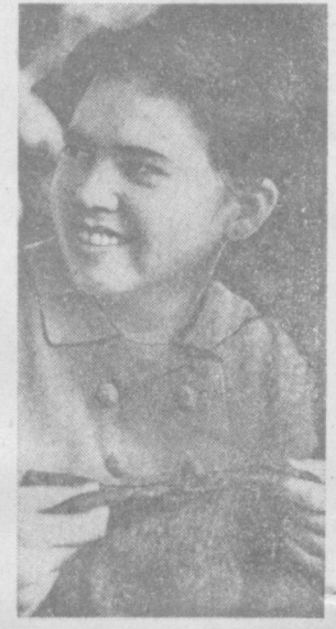
Бустонлик район Советининг биринчи сессияси

1968 йил 30 декабрда Ҳазратиш шаҳрида янги ташинган элтим мекнатлилар депутатлари Бустонлик район Советининг биринчи сессияси бўлиб ўтди.