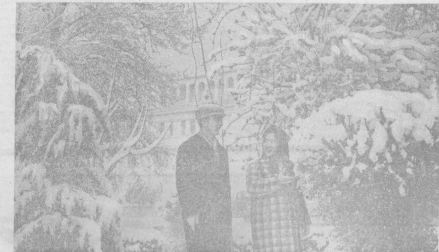
ТОШКЕНТДА чинакам киши. Қор устига қор ёғилити! Мана бу манаарга бир назар ташланг. Сибирь қишини эслатади. Опоқ қор билан бурканган арча «уз туши»ни кийган. Суратларда: Тошкент киши либосида.

Фарзанд тарбиясида мастулийатли вазифа энг аввало ота она зиммасига тушади. Бу мастулийатли вазифани муваффақиятли адо этаётган, Ватан ва халқ ишига садоқатли, одобли ва билимли фарзандлар тарбиялаб етиштираётган ота-оналар бизда оз эмас.