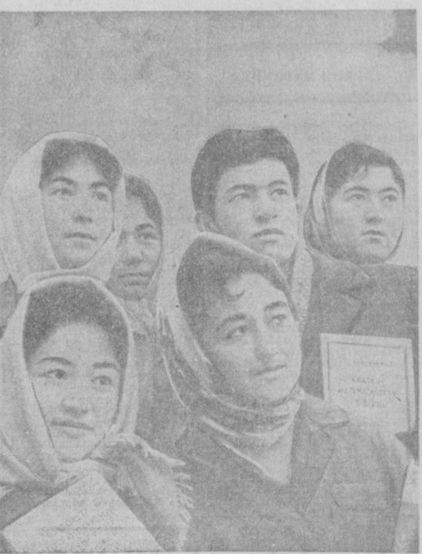
Б. И. Ленин номидаги Тошкент Давлат университетидида ўн беш мингта яқин студент ўқишда. Журналистика факультетидида таълим олаётган йилитқизлар бўлажак касба меҳр қўйган студентлардир. Суратда: факультет студентларидан бир гуруҳмаси.