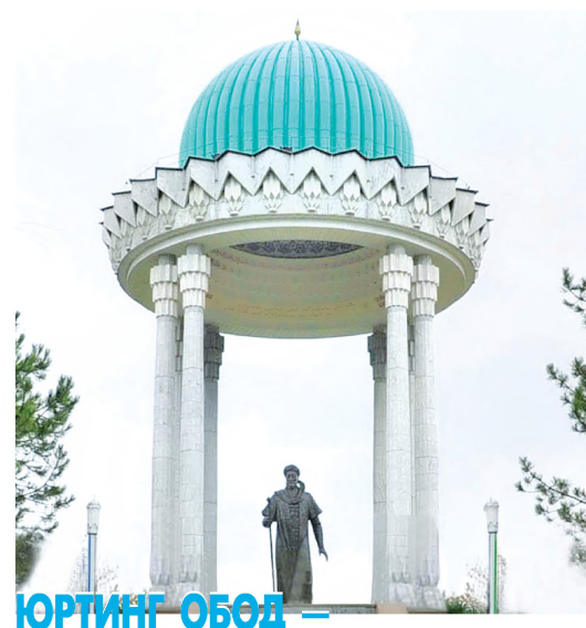
ЮРТИНГ ОБОД — ДИЛИНГ ОБОД НАМАНГАН ВИЛОЯТИ

Наманган азалдан гуллар шаҳри, дея ном қозонган. Бугун ана шу таърифни бугун вилоятга нисбатан қўлласа арзийди. Чунки кейинги уч-тўрт йил ичида Наманган шаҳридан тортиб, энг чекка туманларгача асосий йўлнинг икки чети замонавий архитектура талаблари асосида янгидан барпо этилмоқда. Бунда йўл ва йўлқачларини йилнинг уч фаслида барқ уриб турадиган анвойи гулларга бурқаш, ландшафт дизайнига эътибор қаратиш билан бирга, янгидан-янгидан маънавий хизмат кўрсатиш шохобчалари фаолиятини йўлга қўйиш, аҳоли турар-жойлари ва объектларнинг ташкил қилинишига кўрамаштираш доимий эътиборимизда.