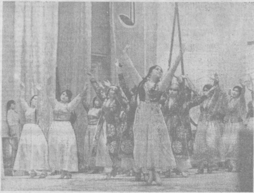
▲ ОБЛАСТИМИЗДА бадий ҳаваскорлик тўғрақлари иштирокчиларининг сафи тобора кенгайиб бормоқда. Ҳаққ талантилари ўзларининг маҳоратларини куриқларда, конкурсларда намойиш этмоқдалар. Суратда: «Мархабо, талантлар» шиори остида ўтказилган телефестиваль иштирокчиларидан бир группасини кўриб турибсиз.

Иўқ хуари ёлғиз эса ўз киши. Қайда киши сонда ёлғуз киши. Фард киши даврда тоғмас наво, Ёлғиз овучдин киши эшитиши сано!