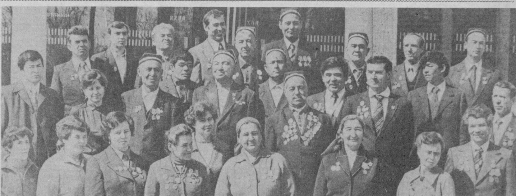
● СУРАТДА: социалистик мусобақа голиблари — область мукофотлари лауреатлари.

қиятли бажариш учун хў-жалик ички резервларини сафарбар этиш борасида қўйган вазифаларни ҳал этишга муносиб ҳисса қўш-дилар. КПСС Марказий Комитети, СССР Министрлар Совети, ВЦСПС ва ВЛКСМ Марка-зий Комитети Коммунистик шанбалликда актив қатнаш-ганликлари учун ишчилар, колхозчилар, инженер-тех-ник ходимлар ва хизматчи-ларга, уруш ва меҳнат ветеранларига, Совет армияси ва флотининг жангчилари-га, студентлар ва ўқувчи-ларга самимий миннатдор-чилик назор этадилар. Шанбалик ўтказиш нати-жасида олинган маблағни соғлиқни сақлаш муассаса-лари, мактаблар, болалар боғчалари ва яслилари қў-риш учун иттифоқдош рес-публикалар, Москва ва Ле-нинград шаҳарлари ихтири-га юборишга қарор қилинди.