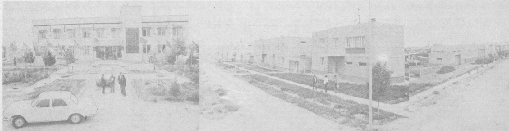
▲ СУРАТДА: Илчч посёлкасидаги маъмурий ва турар-жой биноларининг кўриниши.