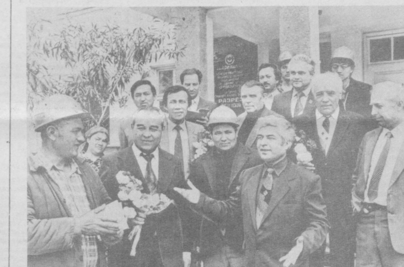
СУРАТДА: ёзувчилар шахтёрлар хузурида.

ОРЖОНКИДЗЕ районидagi Бутуниттifoқ пахтачилик илғий-техник институти маърузий экспериментал базаси чорвадорлари байрам арафасида давлатга сўт ва тўш топшириш ярим йиллик пайларини ортиқ билан бажаришди.