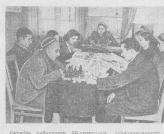
Октябрь районидagi 88-агитпункт сайловчиларининг севимли жойи бўлиб қолаётди. Унда сайловчилар янги газета ва журналларни ўқиб, лекциялар тингловдилар. Суратда: сайловчилар агитпунктда.