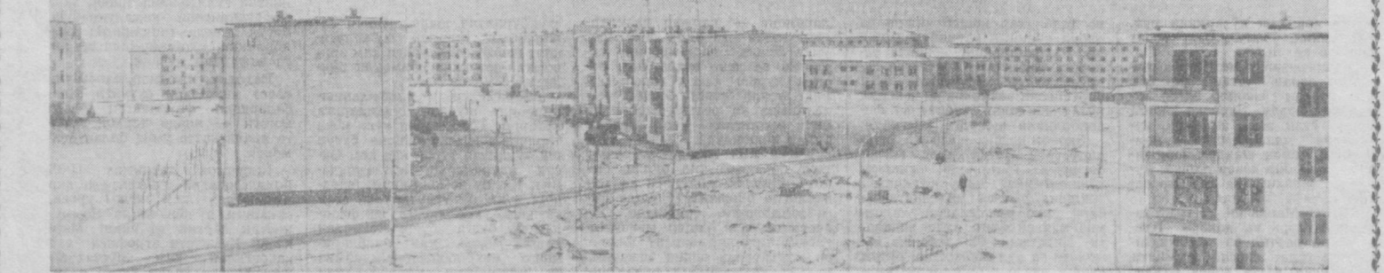
Суратда: янги йил арафасида Високовольтий кўчасида фойдаланишга топирилган турар-жой биналарини қўриб турибди.