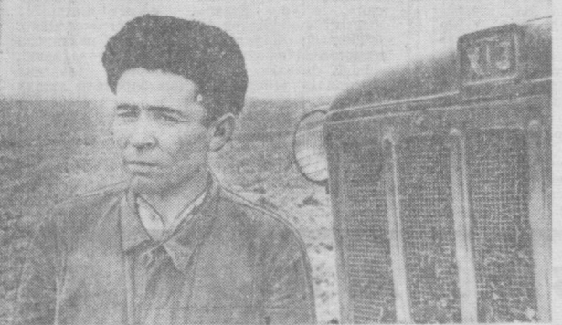
Урта Чирчиқ районидagi «Ленин йўли» колхозин пахтакорлари давлатта 6 минг тоннадан энг пахта сотиб, ўтган хўжалик йилини муваффақиятли янгуналанди.

ВАРШАВА, 18 январь. (ТАСС). КПСС Марказий Комитетининг Биринчи секретари Л. И. Брежнев, СССР Министрлар Советининг Раман А. Н. Косыгин, КПСС Марказий Комитетининг секретари Ю. В. Андропов, СССР муҳофа министри Р. Я. Малиновский ва СССР ташқи ишлар министри А. А. Громинолардан иборат Совет делегацияси Варшава шартномасида қатнашувчи Давлатлар Сўёсий консультатив комитетининг мажлисида иштирок этиш учун бугун Варшаваға келди.