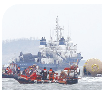
Йўқолганлар ҳисобида. Ҳозирда 550 нафарга яқин киши, 212 кема ва 34 та ҳаво кемаси қидирув ишларини давом эттирмоқда. Кучли сувоси тўққилари қўтқарув ишларини қийинлаштирмоқда.

Жанубий Кореянинг «Севоль» кемаси ҳалокати оқибатида ҳаётдан кўз юмганлар сони 180 нафарга етди.