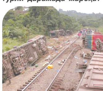
Кўрбонлар сонининг яна ортиш эҳтимоли бор. Боиси вайроналар остида жасадлар бўлиши мумкин. Конго темир йўлига миллий компаниясига тегишли поезд Катанга музофотида изидан чиқиб кетган.

Конго демократик республикаси жануби-шарқида йўловчи поезднинг ҳалокати оқибатида камида 30 киши ҳаётдан кўз юмди, 50 нафардан зиёд одам турли даражада жароҳат олди.