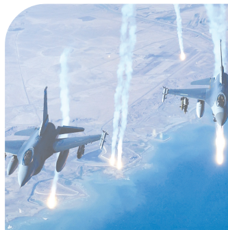
Тўлибон ҳўракати ва «Лашкари Ислому» гуруҳи фаол

Покистон расмийлари Афғонистон билан чегарадош ҳудудга берилган ҳаво зарбалари оқибатида жангари сифатида гумонланган 37 нафар киши ҳалок бўлганини эълон қилди.