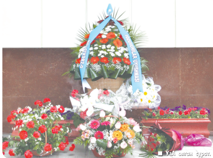
Ушба олдига гуллар.

«Туркистон» саройида 25 апрель кунини Ўзбекистон халқ шоири Муҳаммад Юсуф таваллудининг 60 йиллигига бағишланган ижодий кеча бўлиб ўтди. Унда парламент аъзолари, ёзувчи ва шоирлар, адабиётшунослар, маънавият тарбиётчилари, ўқитувчилар, кенг жамоатчилик вакиллари, талаба-ёшлар иштирок этди.