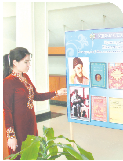
ли ҳаёти ва ижодига бағишланган кўргазма намоиш этилди. Илмий-амалий анжуман ўзбек ва туркман санъаткорларининг концерт дастури билан яқунланди.

Тадбир доирасида вилоят туркман миллий маданият маркази томонидан ташкил этилган Махтумқу-