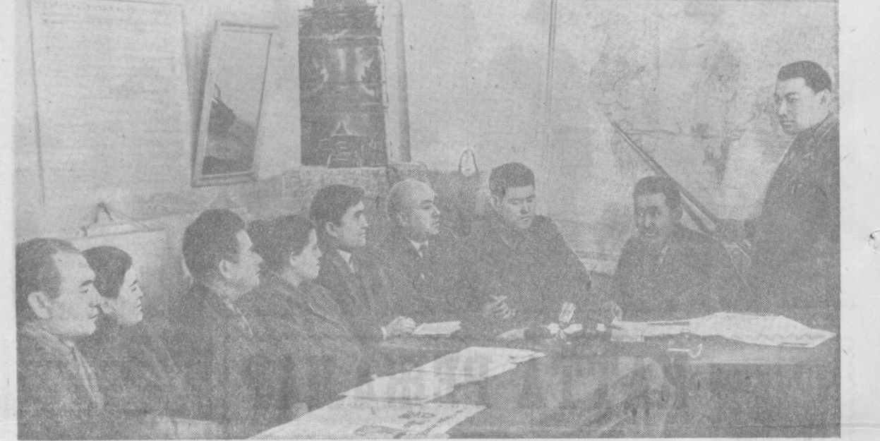
Урта Чирчиқ бошқармасидаги 52-мактабда кутубхоналарнинг сиёсий ўқиш тўғрисида мажлислари ўтказилди...