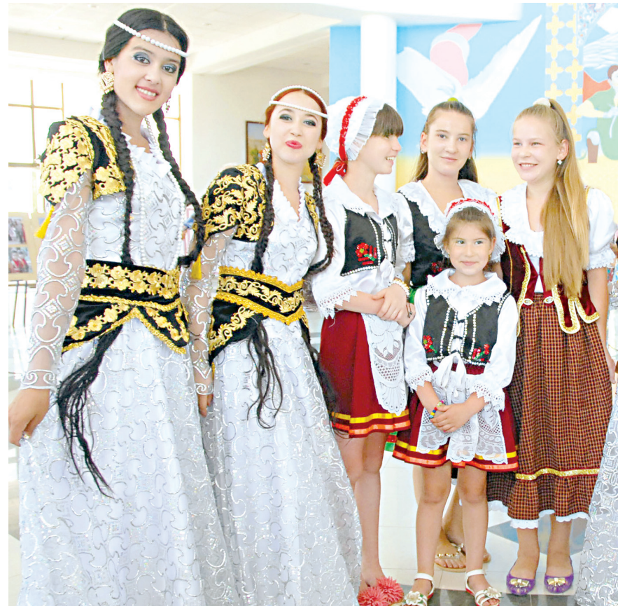
Миллатлараро тутовил ва аҳилликни мустаҳкамлашга, маънавий-ахлоқий тарбияни кучайтиришга йўналтирилган чора-тадбирларни амалга оширишда фуқаролар ўзини ўзи бошқариш органларининг ўрни алоҳида.