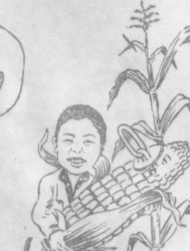
Ли ЛЮБОВГА Ли Любовь Ҳўжорикор, Мўл ҳўсёлдор армон, Дондор қизинг эквани Бўлсин сийлосинг қони!