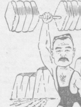
Ҳақимполлов ҚОДИРОВГА Миришкор Ҳақимполлов, Пахтакор аса деҳқон, Янги йилда мўл ҳўсёл — Уюб кўчтин янги шў!