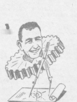
Новатор Незмат ОЧИЛОВГА («Ташсельмаш» заводи), «Ташсельмаш» новатори Янги йилда ҳўжати, Илаланишинг йўли нур, Кўлсини кундек қўбди.