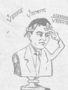
Профессор С. Х. СИРОЖИДИНОВГА Янги йилнинг кайфияти, Еш олимга ёр бўлсин, Фанимиз равиқиди, Зўр ҳиссаси бор бўлсин.