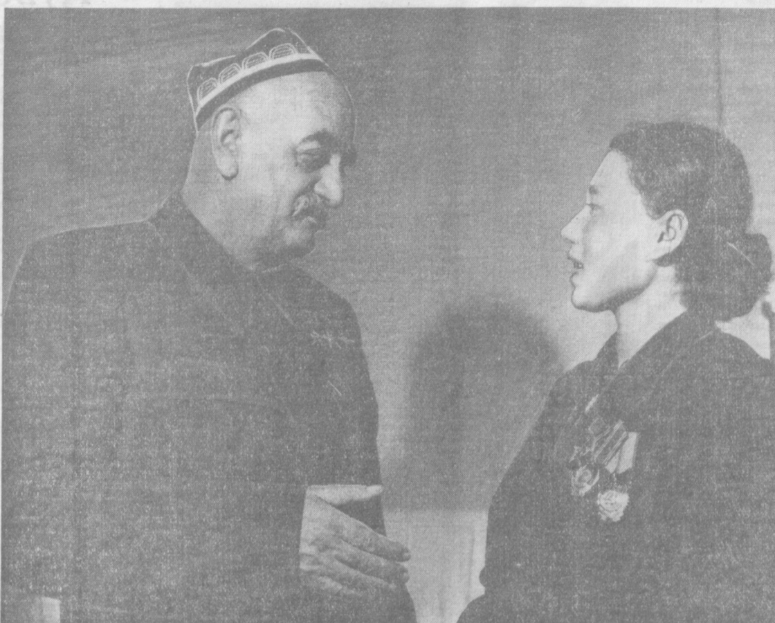
Шоғирд устозни, устоз шоғирдни қутлаб... (Фотокорона)

Янгидагина киши хотирасида абадий қолган воқеа юз берди. Янгийул районидagi Хрушчев номи колхозининг раиси, уч марта Социалистик Меҳнат Қаҳрамони Хамроқул Турсуновнинг унинг туғилган қишлоғида буюқ ўрнатилди. Бу — машур пахтакор Хамроқул отанинг катта хўжаликка чорак ардан ортқи моҳирлик билан бошчилик қилиб келганлигини, совет пахтачиллигини ривожлантириш ишига муносиб ҳисса қўшганлигини ёрқин тисмонлидир.