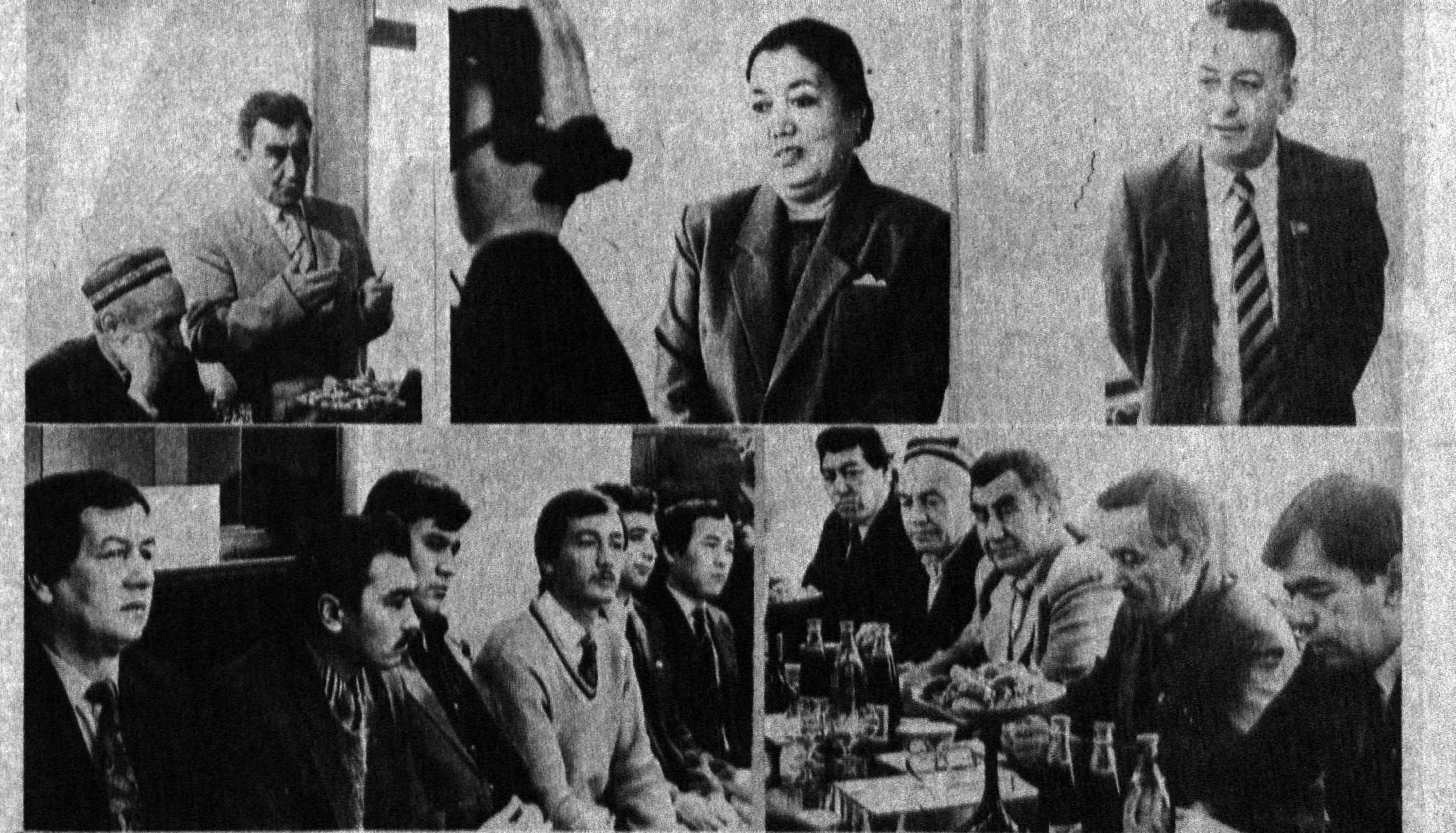
СУРАТЛАРДА: учрашувдан пайдаланган.