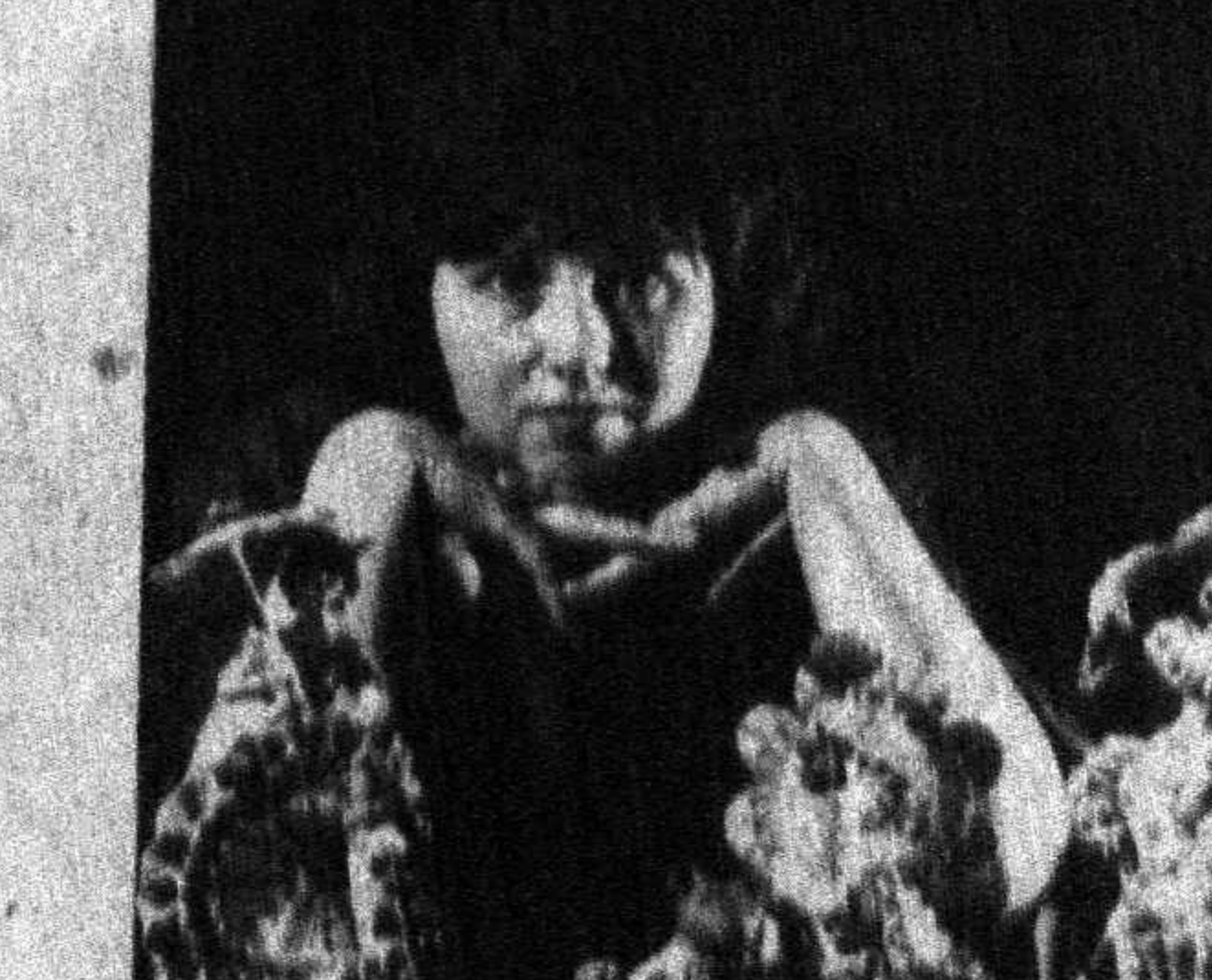
кеңг ёйилмаган, Октябрь инқилобин амалга ошмаган бўларди. Нечанча алоқалар адолатли ва фаровон жамиятин орзу қилиб келдилар. Афсуски, ер юзиде ҳали идеал жамият яратилган эмас. Бизнинг бугунги ҳаракатимиз, қайта қуришдан кўзлаган мақсадимиз ҳам жамиятинимизни ана шундай мукамил қуриш йўлидаги уринишдир. Шарқий Европада ҳам худди ана шундай жараёнлар келмоқда. Социализм ҳамдўстлигининг янада тақомиллашган ва самарали қилиш вужудга келади деб ўйид қилмиш.

«Болалар ўзларининг қилаганини билишгандоқ яратадилар» — деб ёзди Англиянинг «Нью сайенс» журнали. Ҳатто, кўпчилик одамлар фарзандларининг қандай ўйинларга ва ўйинқоқларга бўлган қизиқишларини кўриб, келгусида қайси соҳани эгаллашини айтиб бера олар экан. СУРАТДА: журнал саҳифаларида эълон қилинган шундай расмлардан бири.