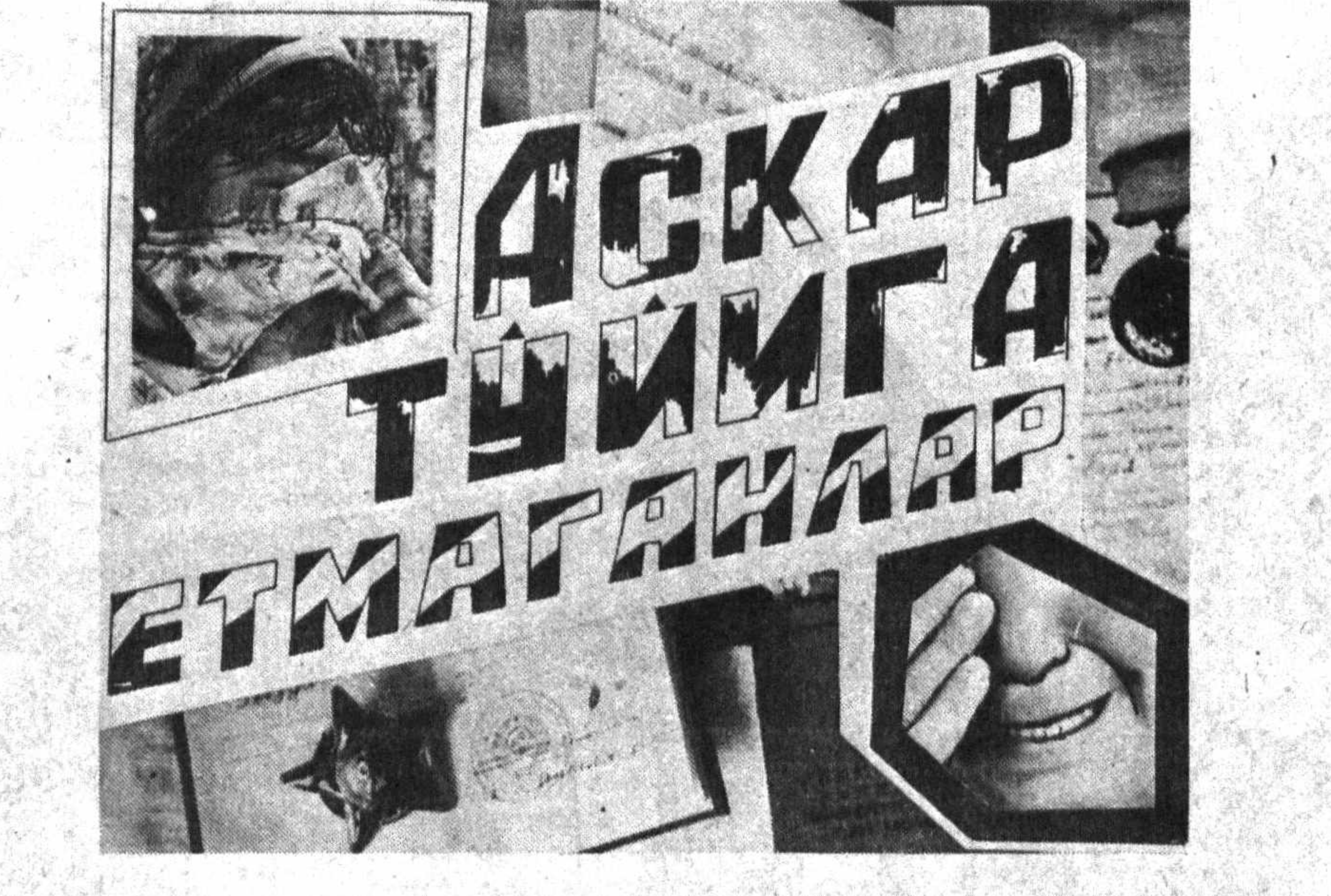
РЕДАКЦИЯГА КЕЛГАН МАКТУБЛАРНИ ЎҚИБ...

«...Акам Маъмуржон Қозоғистонда хизмат бурчини ўтаётган, фожиаки ҳалок бўлди. Катта акам — Мадамжоннинг Афғонистондан соғ-омон қайтганига шукр қилиб юргандик. Тинч жойда хизмат қилиб юрган акамнинг ўлганига ҳали ҳам ишонгим келмаяпти...» деб ёзади учқўрғонлик Гулчехра Гафурова.