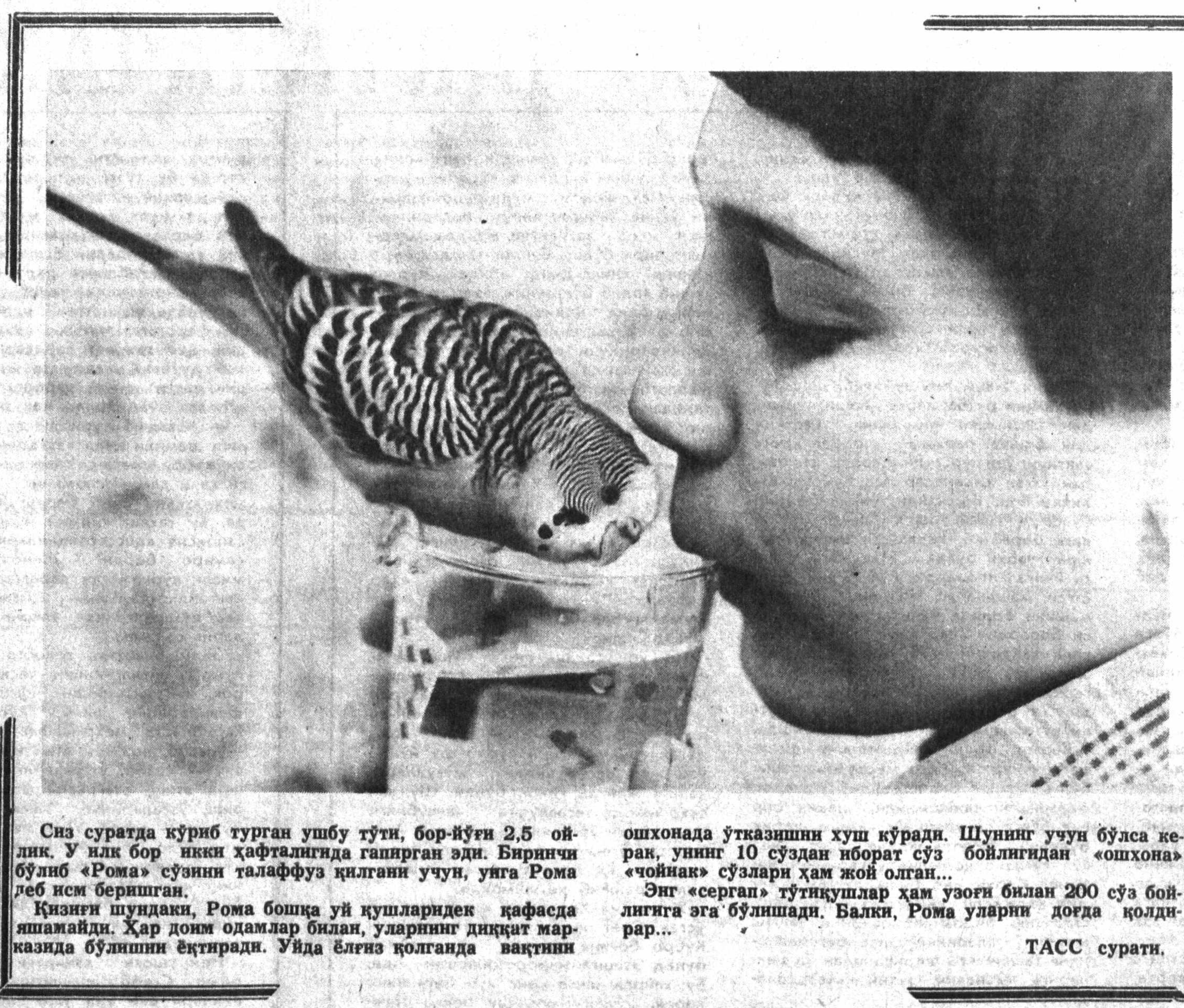
Сиз суратда қўриб турган ушбу тўти, бор-йўғи 2,5 ойлик. У илк бор ники дафталигизда гапирган эди. Биринчи бўлиб «Рома» сўзини талаффуз қилгани учун, унга Рома деб исми беришган.

«Еш ленинчи»да қўшиқчи «Ранг-баранг олам» ойнасуз остида берилган қизиқ-қиз қабарлар орасида бу рекорд, натижа, ютуқ «Гиннеснинг рекордлар китоби»дан ўрин олган, деган жумлаларни ўқиймиз. Айтишчи, Англияда нашр этиладиган бу китоб яна қайси мамлакатларда нашр этилган? Ушбу китоб ҳам босилганми? — 1988 йилгача бўлган рекордларни ўз ичига олган «Гиннеснинг рекордлар китоби» 20 сўмдир.