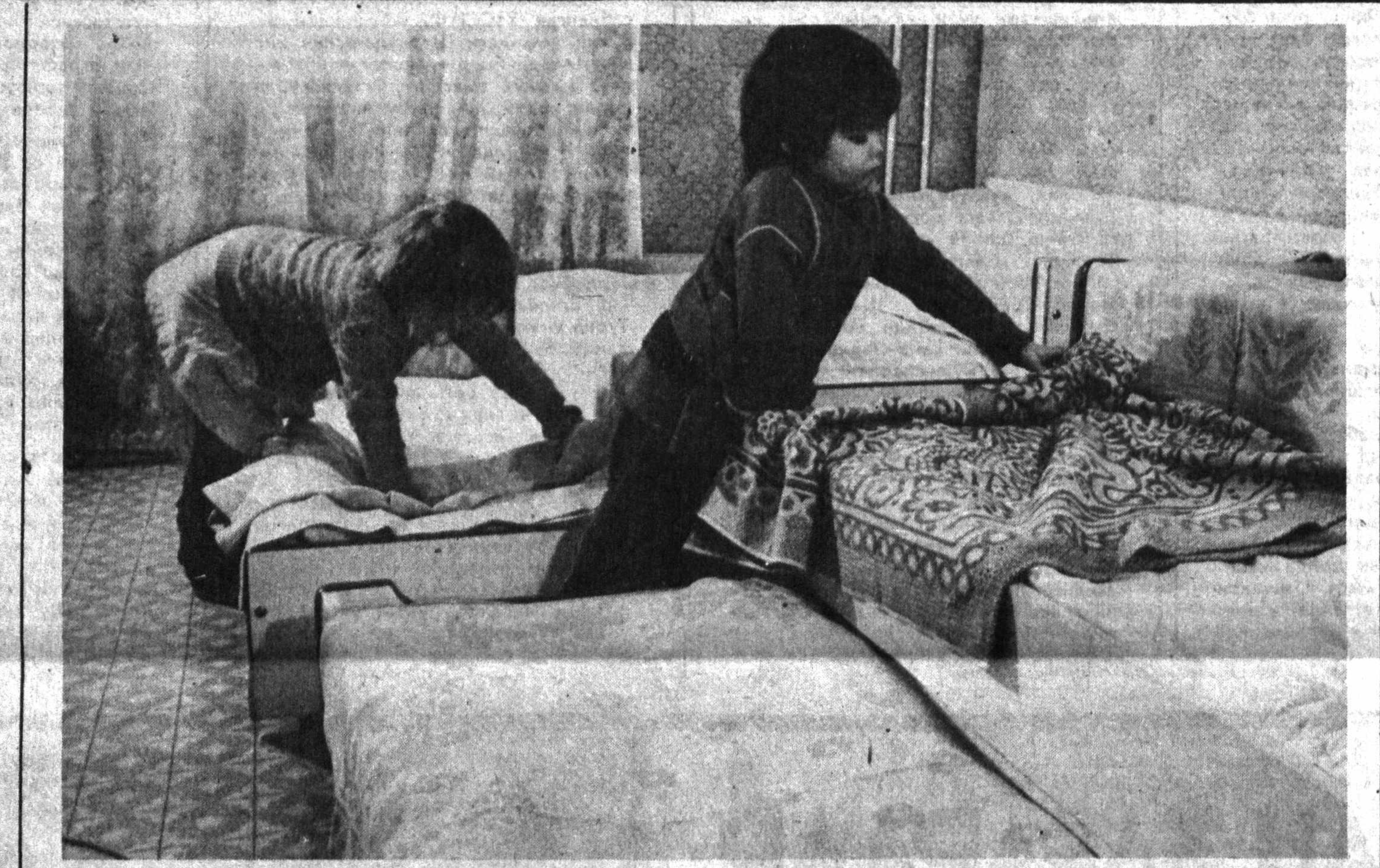
Наманган шаҳридаги «Чаманзор» массивининг янги туғдиқ қавати ўйларидан бирида 12 нафар кичкинтой ўқув боғча очилди.

ри ҳақида ёзиб ўтирсам, комсомол қўмитамизга Ю. Колесников кириб келди. Узи тўғрисида ёзилган «III группа ногирони» деган сўзларни ўқиб, жиддий — Бунга қаердан билидинг?