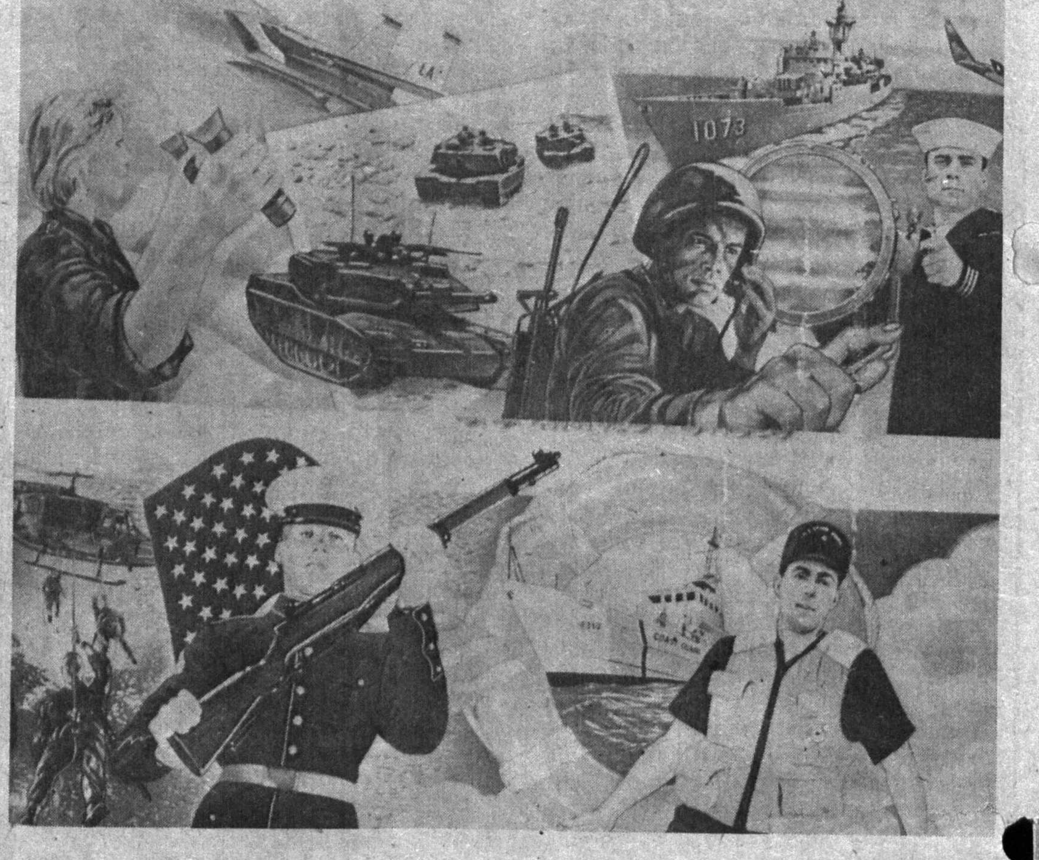
«Вақтин Кўдротмасдан Ватан озодлиги учун Амриқо армиясига хизмат қилишга кел» Ушбуга ўхшаган шпорлар бугун Амриқо матбуотида кўриш мумкин...