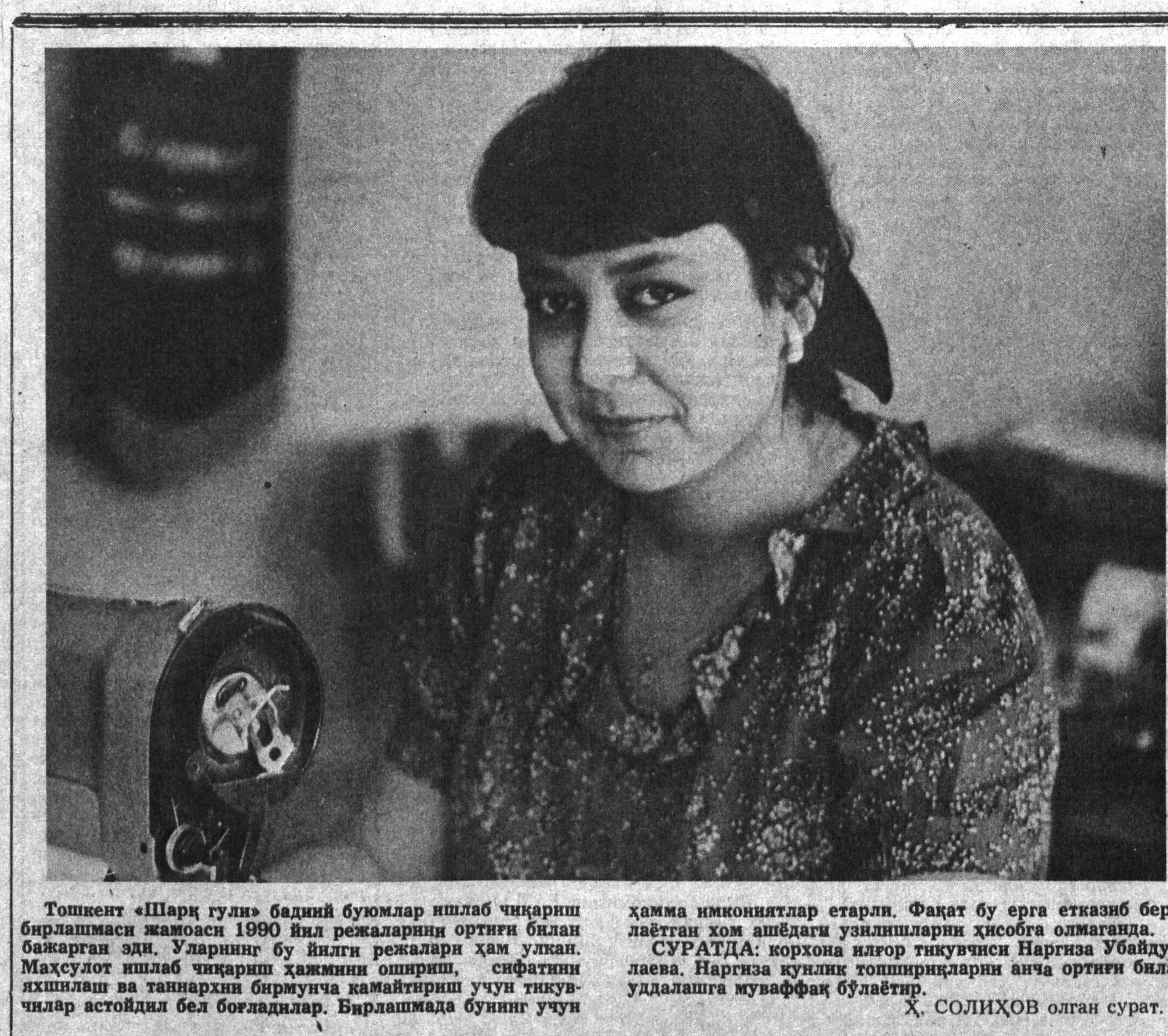
Тошкент «Шарқ гули» бадий буюмлар ишлаб чиқариш бирлашмаси жамоаси 1990 йил режаларини ортиги билан бақарган эди. Уларнинг бу йилги режалари ҳам улкан. Маҳсулот ишлаб чиқариш ҳажмининг ошириши, сифатини яхшилаш ва таннархин бирмунча камайтириш учун тикучилар астойдил бел боғладилар. Бирлашмада бунинг учун