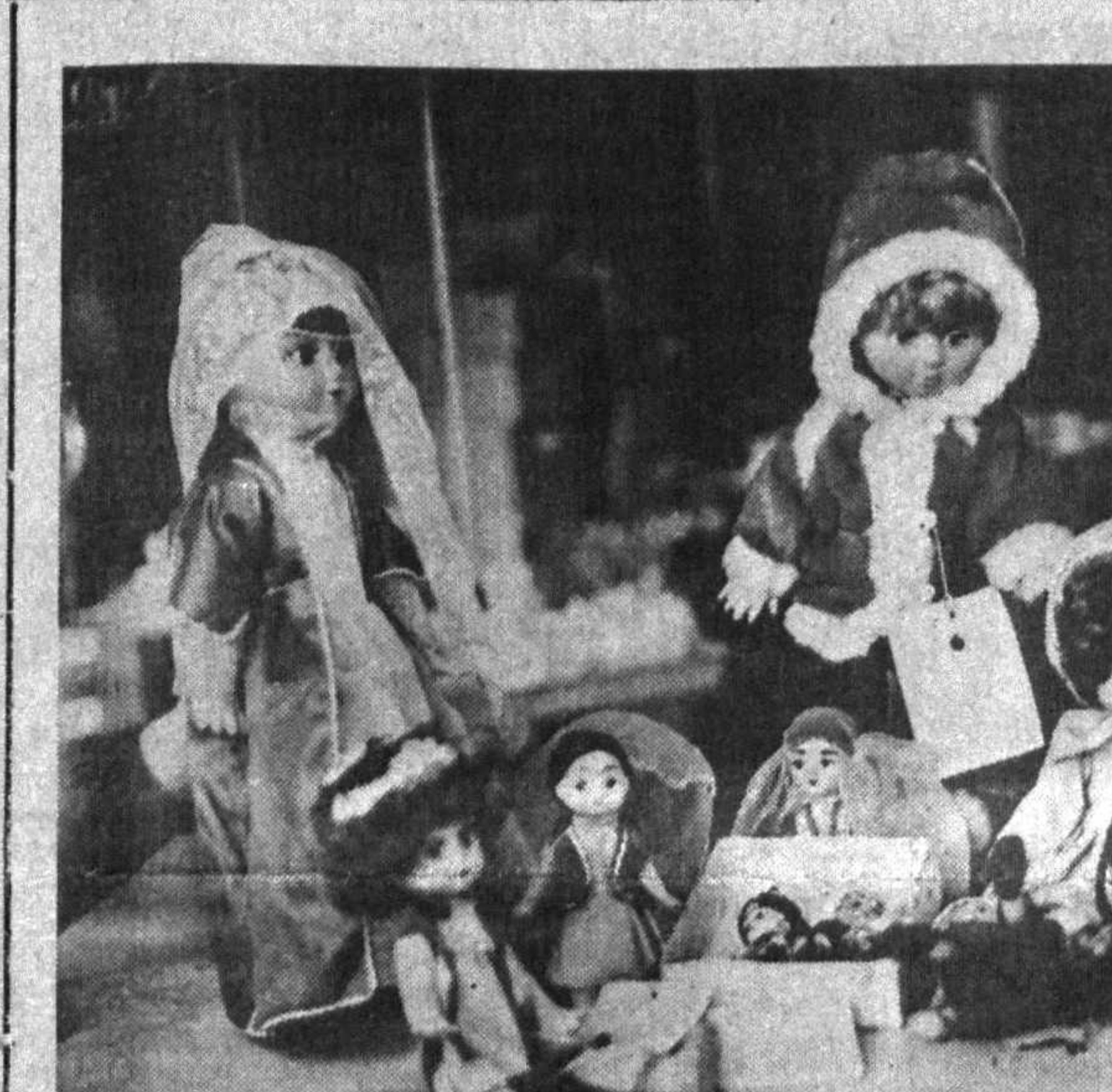
Хар кунни жанжи фар-задиларнинг қўнчилиги ўйинчоқлар оладилар. Севин-лик кўнқирчоқларни ўзларига аллайдилар. Авайлаб «пар-варин» қиладилар. Бироқ ана шу кенжатоиларнинг қўнқирчоқларининг Тожкент-даги «Семурғ» фирмасида ишлаб чиқарилганлигига ақд-лари етмайди. Болалар учун ҳам, фирма ишчилари учун ҳам муҳими бу эмас. Кич-кинитоиларга қўнчилик эрмак бўлса, «семурғ» чиларга бола-лардаги қўнчинини эшитиб туришса, бас.

У. ОЛИМОВ, Фарғона вилояти, Узбекистон ноҳияси.