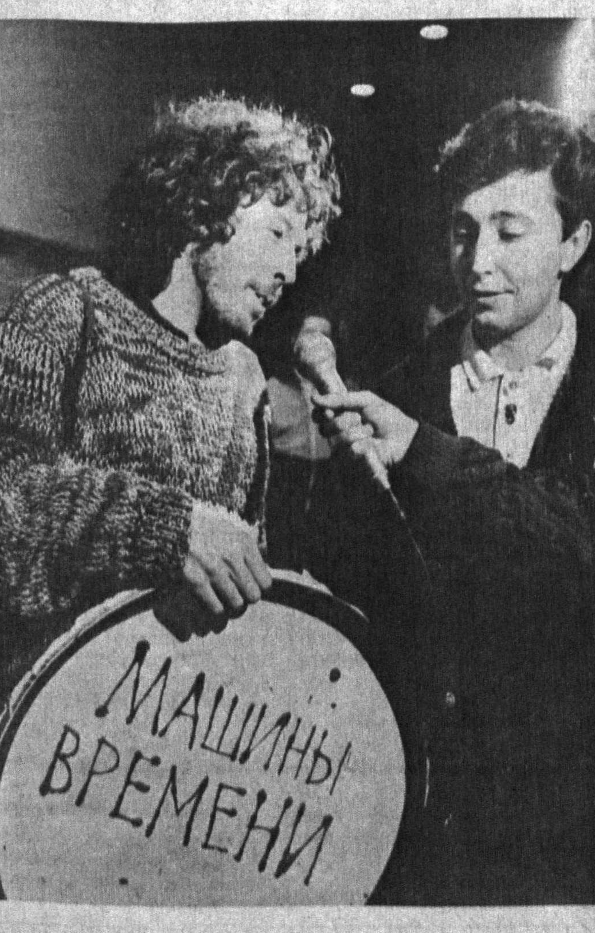
Яқинда Москвадаги Ешлар саройида Рок-н-ролл музейининг кўргазмаси очилди. Кўргазмада қатнашган рок юлдузлари Рок-н-Ролл тарихи билан боғлиқ музика асбоблари, пластинкалар ва кийимларни музейга совға қилишди. Кейин Ешлар саройида Рок фахрийларининг концерти бўлиб ўтди. Чадагга суратда таниқли хонанда А. МАКАРЕВИЧ музейга «Машини вақт» ансамбли биринчи барабанининг нусхасини музейга совға қилапти.