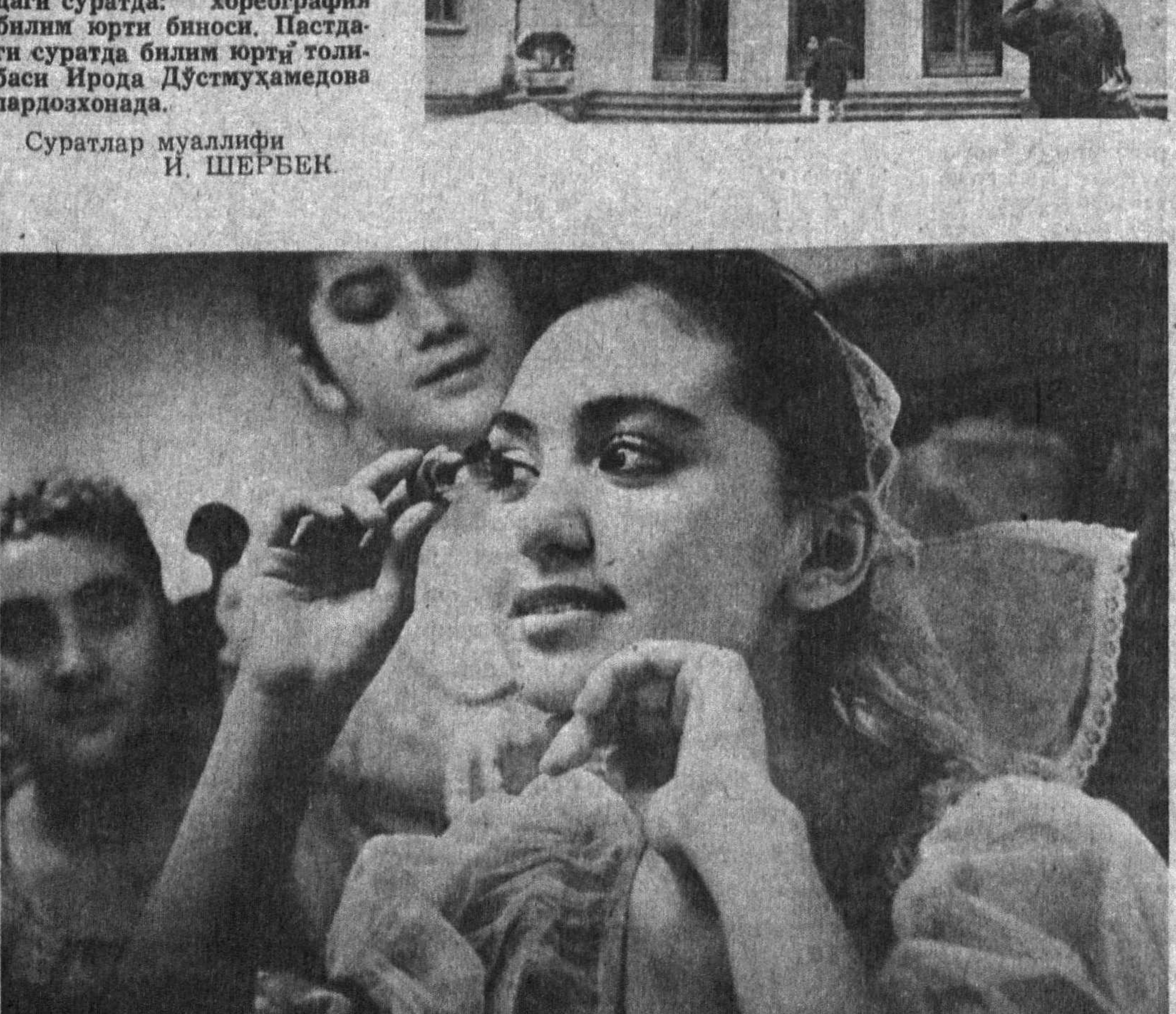
СУРАТДА: «Гулшан» дастаси қатнашчилари.