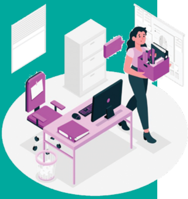
Ходим иш берувчи томонидан меҳнат шартлари ўзгартирилганлиги устидан шикоят қилишга ҳақли.