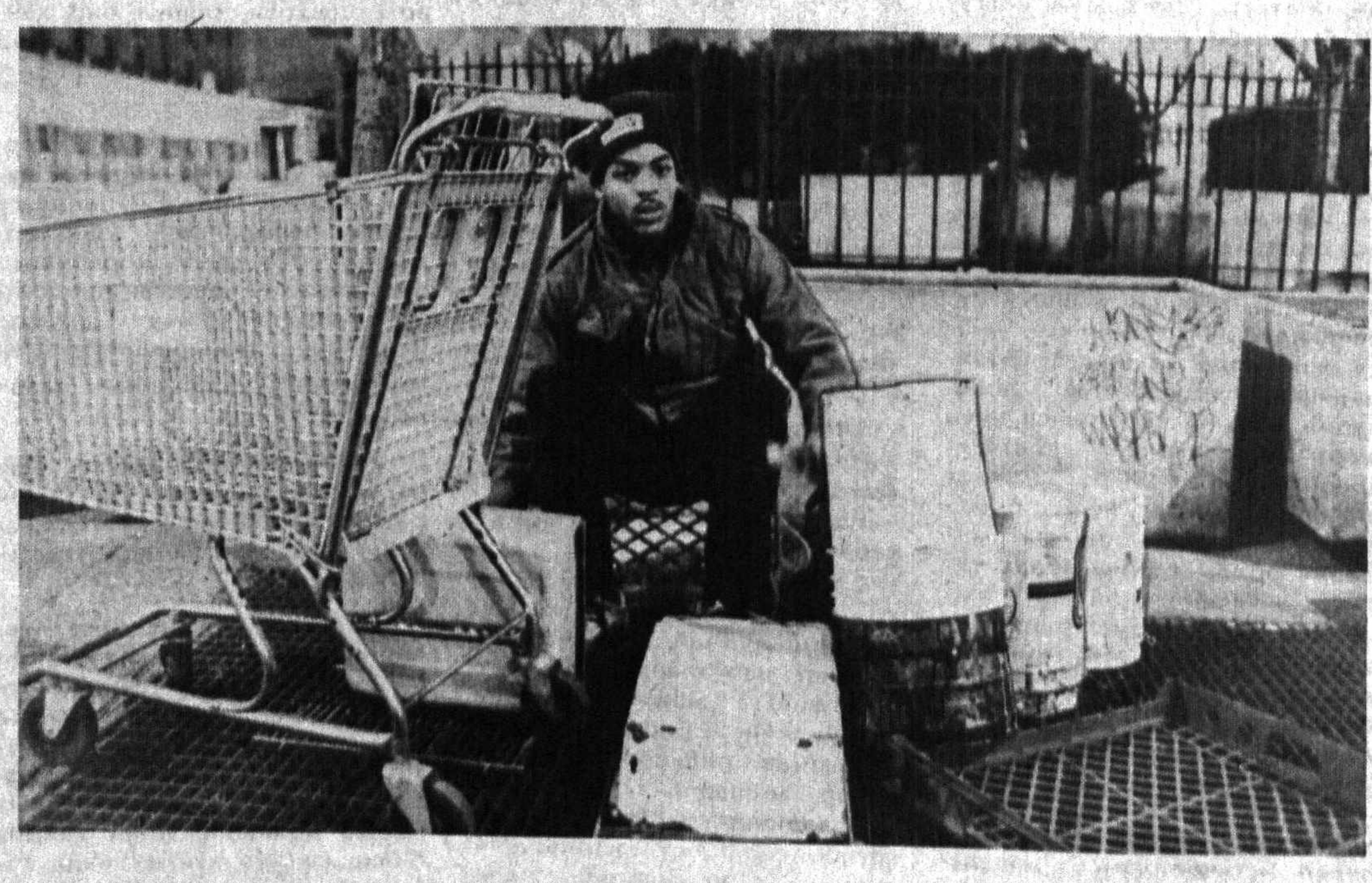
Биз Нью-Йоркда кўча музикачиларини кўп учратганимиз. Бироқ 6-авенюда бу-нақис илгари бўлмаган. Бу йилги турли металл асбоб-буюмлардан музика чиқариб, йўлбуловчи эътиборини тортишни ўзига мақсад қилиб олган. Нью-Йорклик-лар қандай музикани хуш кўришлари ҳа-

Барча зарур нарсалар, ҳа-то реанимация аппаратлари билан таъминланган микро-автомобусларда юрочки юқо-ри малакали шифокорлар от-ряди бўлган «Йўл фаришта-лари» ёрдамида автомобиль-фожалари натижасида одам ҳалок бўлишини яқин бар-вардан зид қамайтириш мумкинлашяпти. «Виа-Дри» йўлининг бошлан-гидан то охиригача «Тез ёр-дам» постлари қўйилган бў-либ, улар кечаю-кундуз ти-нимсиз ишлайди. Улар жабр-ланганлар хузурига етиб ке-лиши учун қўпи билан 10 — 20 минут керак бўлади.