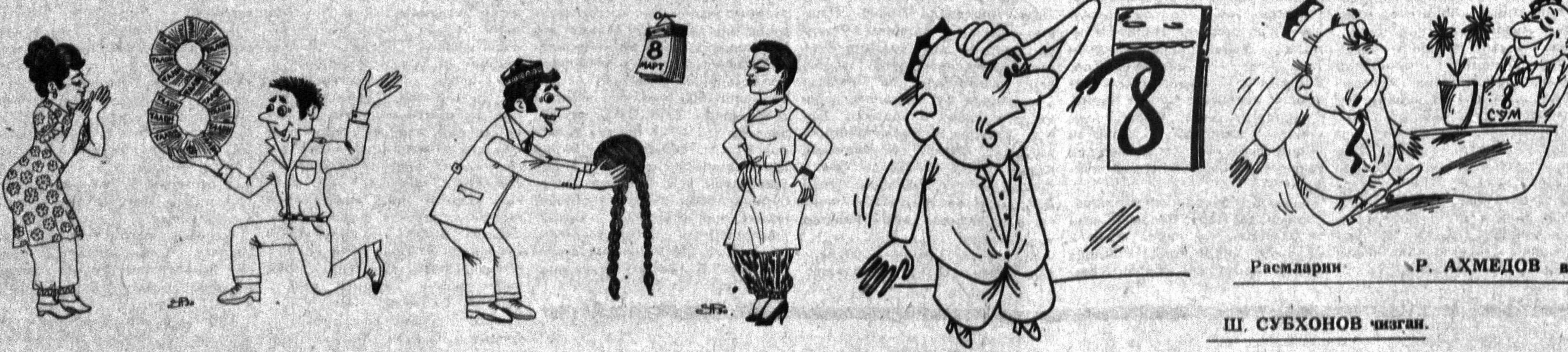
Расмларини Р. АҲМЕДОВ ва Ш. СУБХОНОВ чизган.