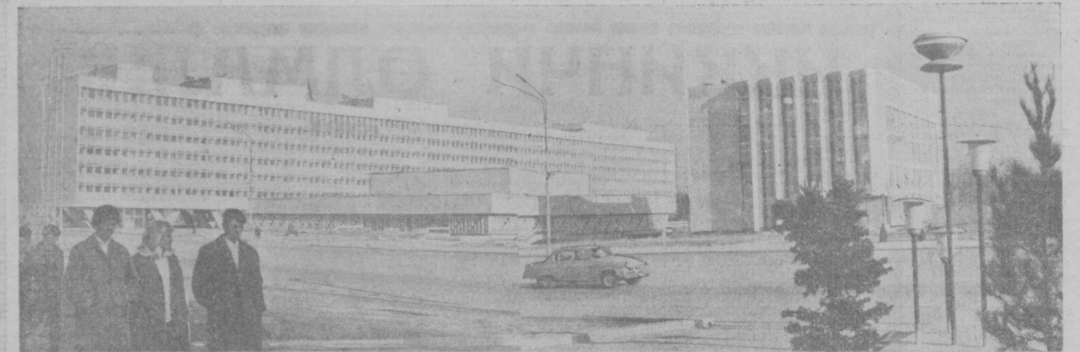
Гузал Тошкентимиз жамоли ой сайини очибди бораяпти. Қўшқаватли кўркем иморатлар, файзалхиёболар, кенг-кенг кўчалар пойтахт кўркига кўрк, ҳуснига-хусни кўшайпти. Ушбу суратда: В. И. Ленин номли қизил майдонда қад кўтарган маъмурий бинолар тасвирланган.

Г. А. В. А. Н. А. 30 декабрь (ТАСС). Куба халқи Куба революциясида габаба қилган кўнни нишонламоқда.