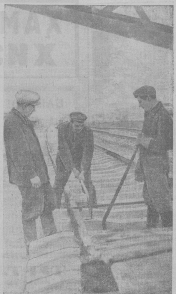
«Средлаэрастрей»га қаршил 182-қурлиш-монтаж посёлгини ишчилари Чилонзорнинг Муқимий кўчасидан Собир Раҳимов станцияси томон янги трамвай линиясини ётқизиштирди. Бу йўлда трамвайлар баҳордан қатъий бошлайди. Суратда: трамвай изи қурлиши участкаларидан бирида. Редактор А. ИСМОИЛОВ