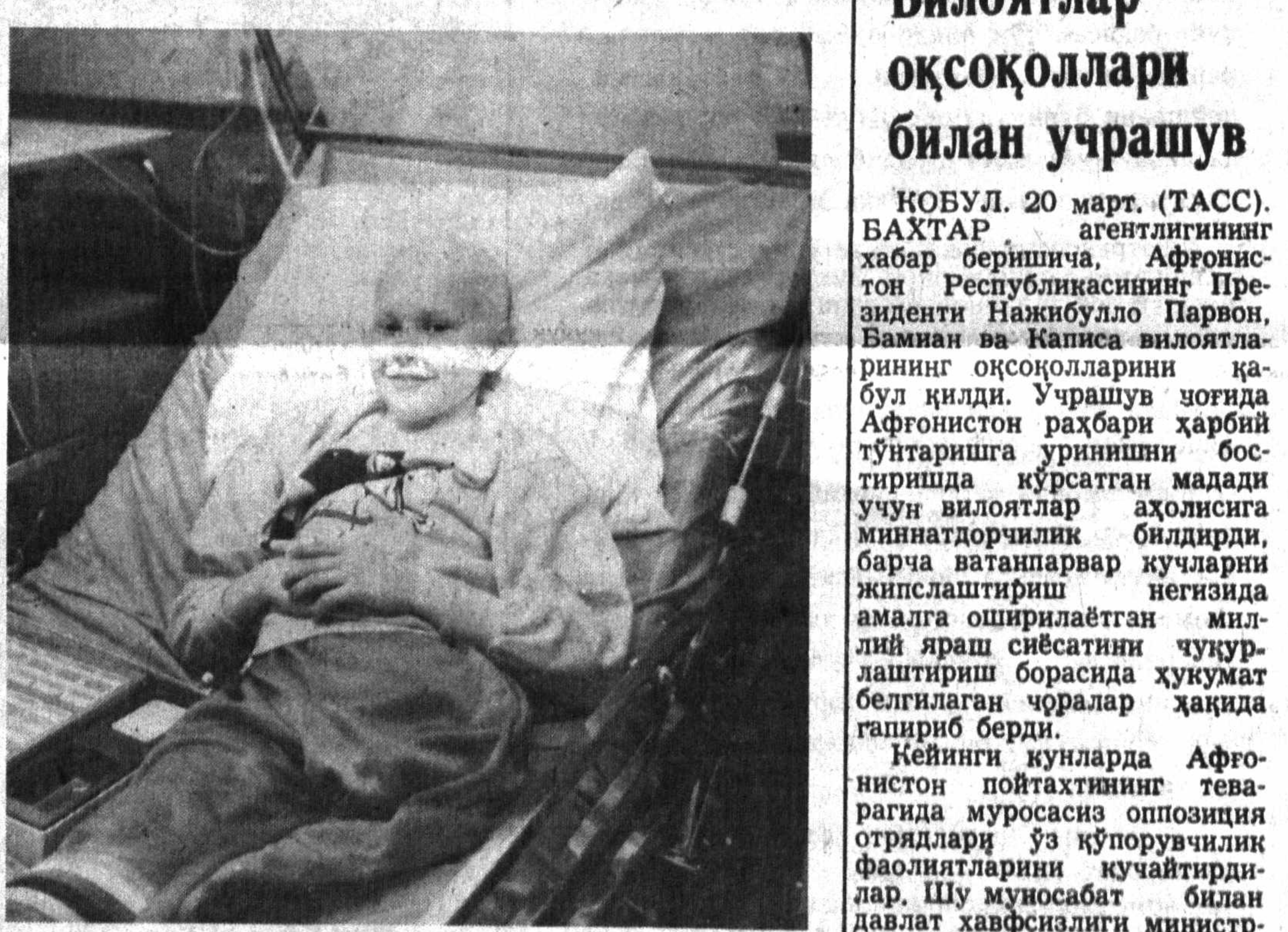
ХЕЛЬСИНКИ. Финляндия дийохидаги болалар касалхонасининг доврўғи нафақат мамлакатда, балки ундан ҳам ташқариди тарқалган десак...