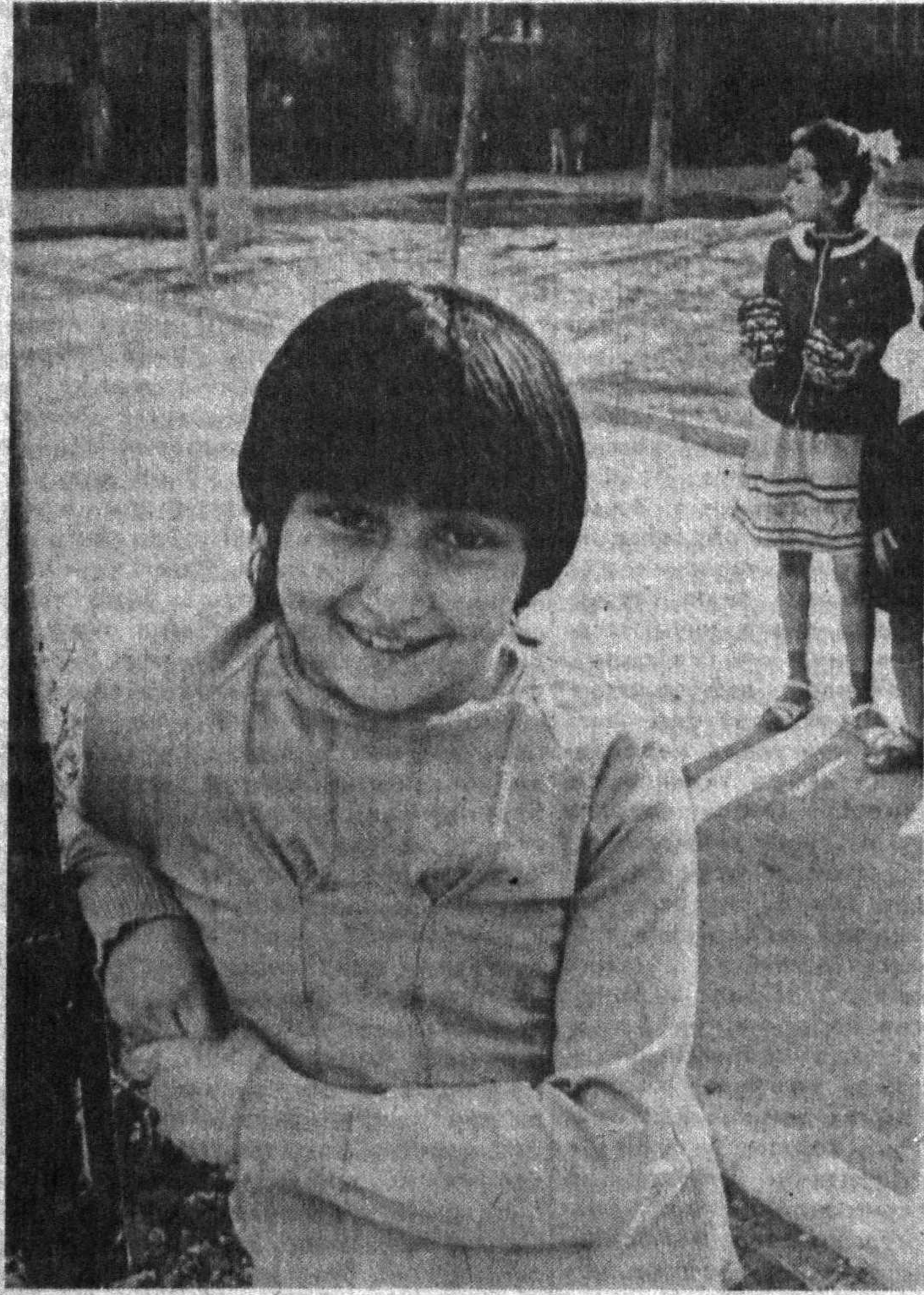
Наврўз... Баҳор... Келажак... Оланинг гўзаллиги.