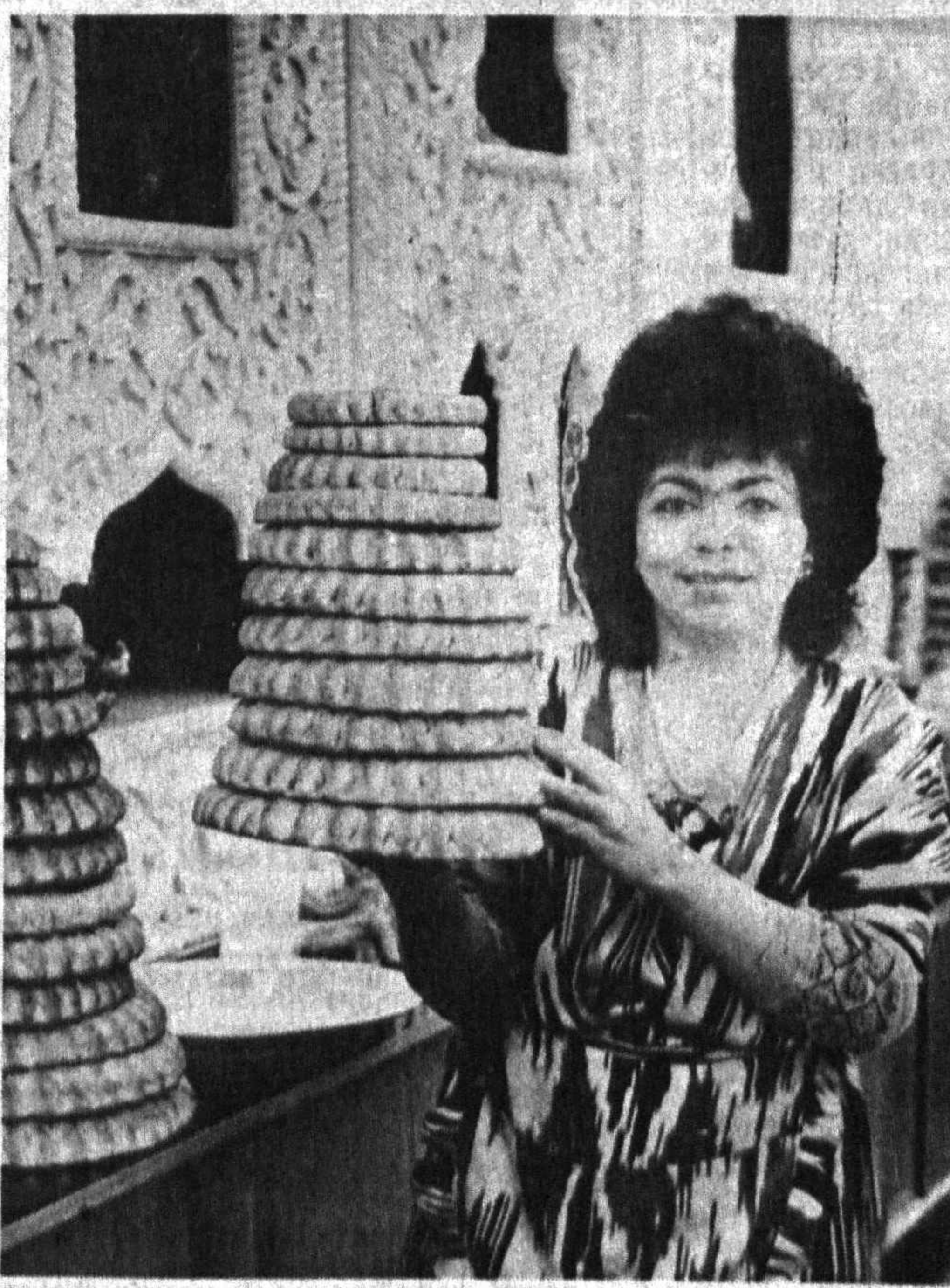
Суратларда: Тошкентда ўтказилган Наврўз тантаналаридан лавҳалар.