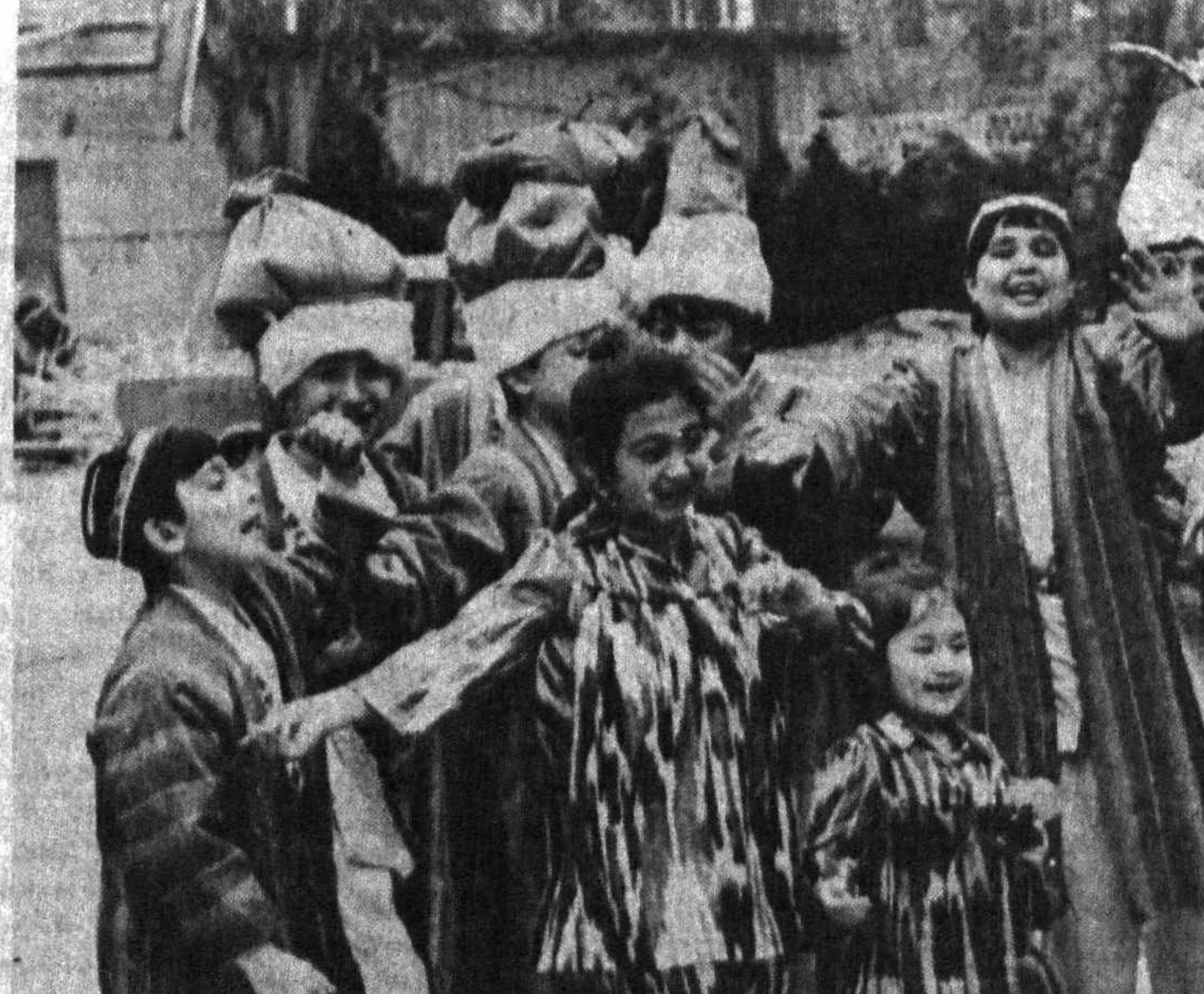
Суратларда: Тошкентда бўлиб ўтган Наврўз тантаналаридан лавқалар.

Саййаҳмад долма 80 ёшли тўйини Наврўз байрамга қўшиб нишонлаш учун институт ҳодисиди катта маърака қозон қурди. Куй сўйилди, ош дамланди. Қадимий одатимизга қўра, ҳаммага тўй оши ва сумалак тарқатилди. Байрам 21 март кўни эрта тонгдамоқ миллий урф-одатларимизга қўра, қарнай ва сурнай садолари билан бошланди. Муаллимлар ва талабалар бир-бирларини Наврўз — Янги кўн билан қўтайди. Ҳўшоов хонанда Ҳўжанибар Ҳўмилов раҳбарлигидаги «Лирна» ансамблининг ашулачи ҳамда рақ