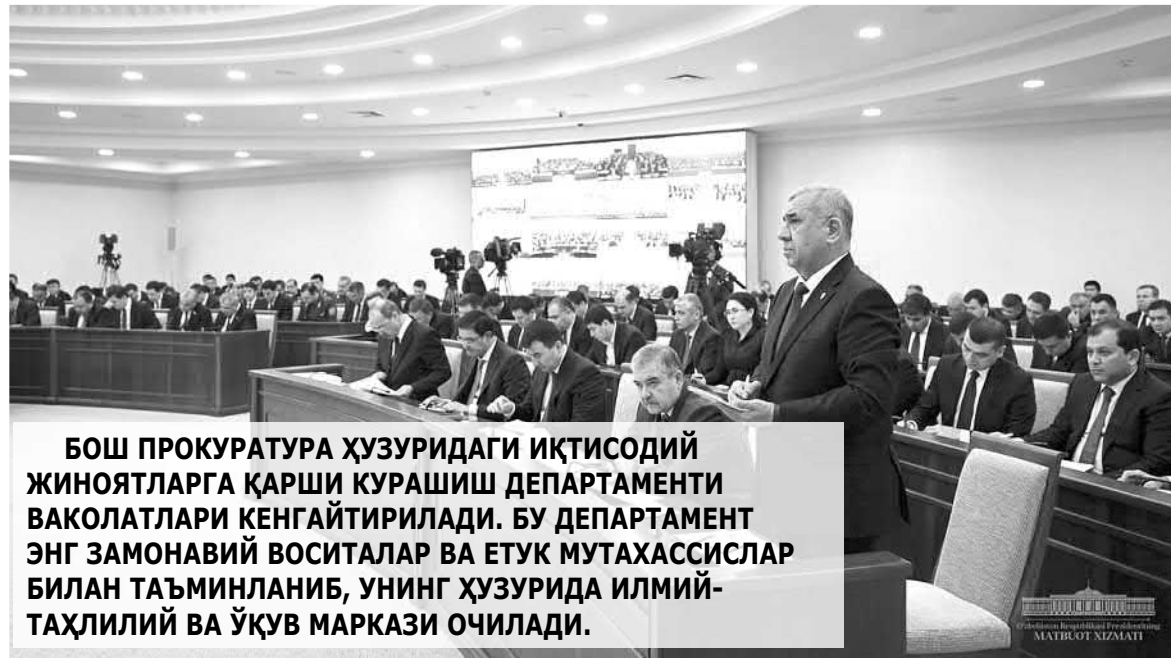
БОШ ПРОКУРАТУРА ҲУЗУРИДАГИ ИҚТИСОДИЙ ЖИНОЯТЛАРГА ҚАРШИ КУРАШИШ ДЕПАРТАМЕНТИ ВАКОЛАТЛАРИ КЕНГАЙТИРИЛАДИ. БУ ДЕПАРТАМЕНТ ЭНГ ЗАМОНАВИЙ ВОСИТАЛАР ВА ЕТУК МУТАХАССИСЛАР БИЛАН ТАЪМИНЛАНИБ, УНИНГ ҲУЗУРИДА ИЛМИЙ-ТАҲЛИЛИЙ ВА ЎҚУВ МАРКАЗИ ОЧИЛАДИ.

Вазирлар Маҳкамасига бу борадаги қолоқликларни бартараф этиб, жорий йилда 20