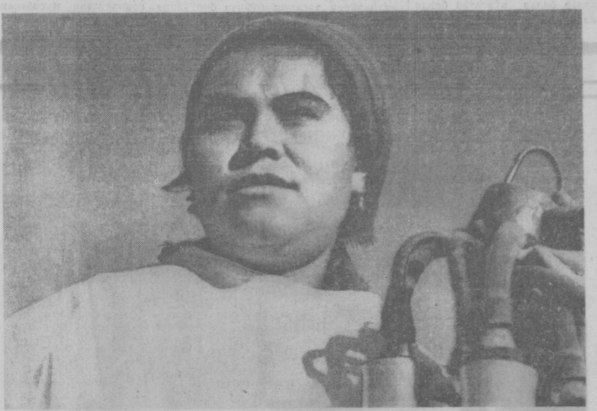
ОРЖОНИКИДЗЕ районидagi «Коммунист» колхозда қўлаб сут соғиб олиш ва давлатга топшириш ишлари яхши кетмоқда.