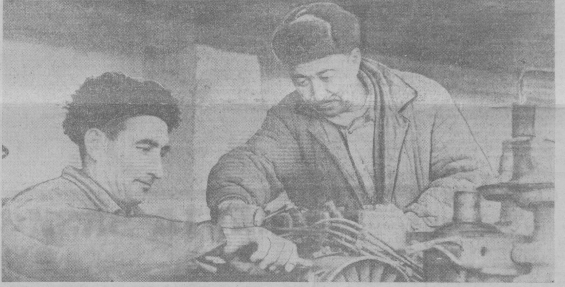
Пойтахтдаги тўқимачилик қўшмаҳлики...