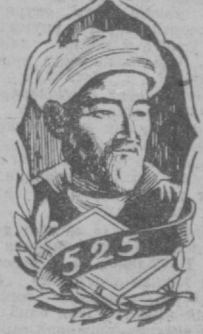
Комитет министрликлар ва идораларнинг раҳбарларига Алишер Навоийнинг 525 йиллик юбилейига тайёргарлик юзасидан бажариладиган барча тадбирларни белгилаган мўддатда ўтказишни таклиф қилди. (ЎзТАГ).

Алишер Навоийнинг 525 йиллик юбилейига тайёргарлик қўриш ва уни ўтказиш республика комитетининг мажлиси бўлди. Мажлис Ўзбекистон Компартияси Марказий Комитетининг биринчи секретари Ш. Р. Рашидов раислигида ўтди.