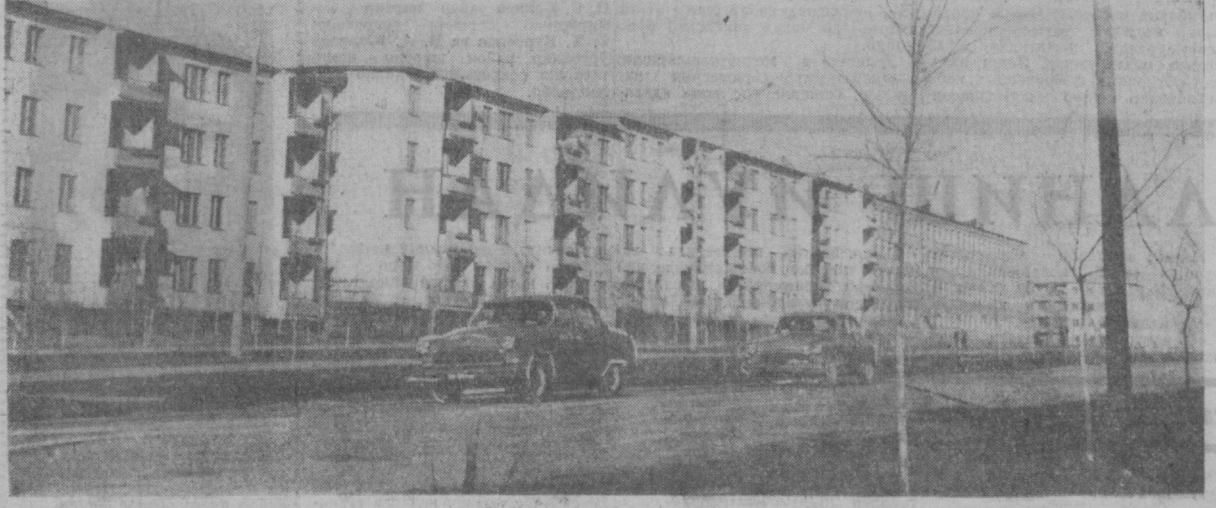
Атоғли шонр Мақсуд Шайхзода номидаги кўча кундан-кунга чирой очиб бормоқда. Қўркам турар-жой бинолари кўча ҳуснига ҳусн қўшипти.

Совет Иттифоқи давлат байроқлари билан безатилган Внуково аэродромида А. Н. Косигини А. П. Кирилленко, К. Т. Мауоров, Д. С. Полянский, Ю. В. Андронов, И. В. Калитонов, М. С. Соломенцев ва бошқа расмий кишилар кутиб олдилар.